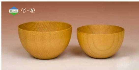
26-256-07 (411127) フリーボウル (ナチュラル)(大) ¥3,100 本体寸法:Φ12.5xH7.6cm 木/ウレタン塗装