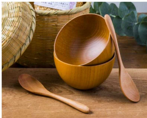
26-256-09 (411080) フリーボウル (ナチュラル)(小) ¥1,700 本体寸法:Φ10xH6cm 木/ウレタン塗装