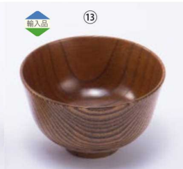
26-256-13 (412335) 一筋汁椀(目摺) ¥1,450 本体寸法:Φ11.5xH6.8cm 木/漆塗装