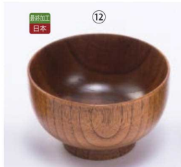
26-256-12 (412338) 都汁椀(目摺) ¥1,450 本体寸法:Φ11.5xH6.8cm 木/漆塗装