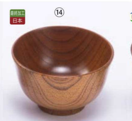
26-256-14 (412337) 京羽反汁椀(目摺) ¥1,450 本体寸法:Φ11.5xH6.8cm 木/漆塗装