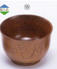
26-256-15 (412336) 羽反小汁椀(目摺) ¥1,200 本体寸法:Φ10xH6.8cm 木/漆塗装