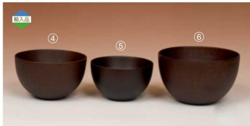
26-256-04(411086) フリーボウル (焦げ茶)(中) ¥2,500 本体寸法:Φ11.5xH6.5cm 木/ウレタン塗装