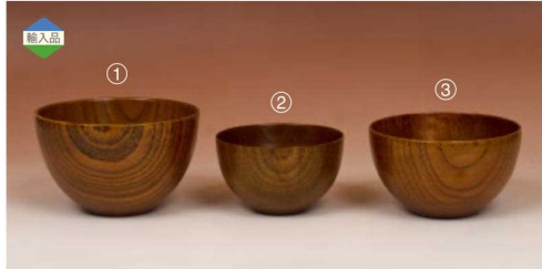
26-256-01(411746) フリーボウル (すり漆)(大) ¥3,100 本体寸法:Φ12.5xH7.6cm 木/漆塗装