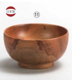
26-256-10 (412521) 子供椀(メイプル) ¥8,200 本体寸法:Φ9xH4.5cm 木/ウレタン塗装