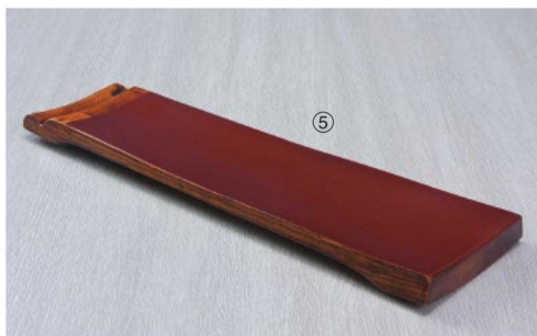
26-268-05 (41612) 樽盛器(赤)(梨地) ¥20,000 本体寸法: W40xD12xH2.5cm 木/漆塗装