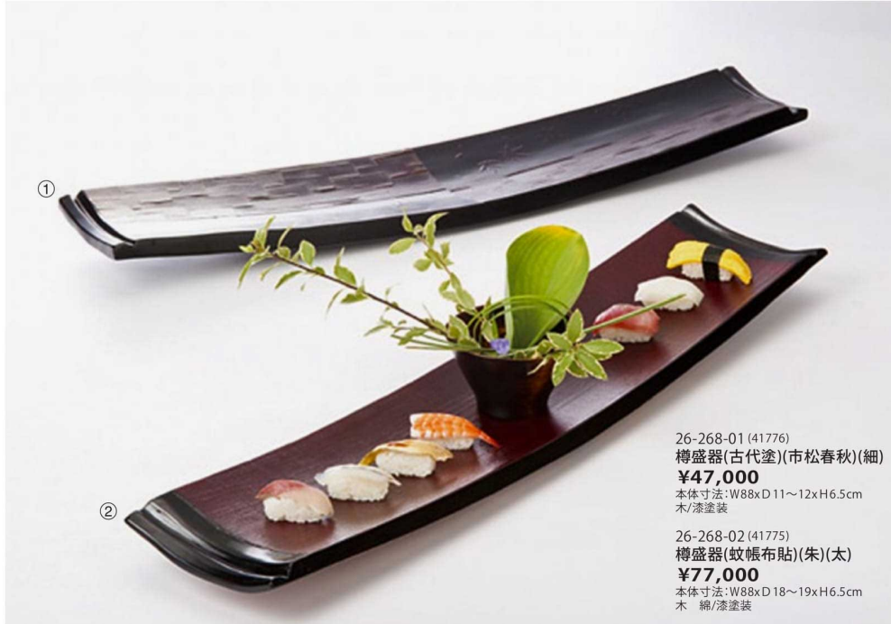
26-268-01 (41776) 樽盛器(古代塗)(市松春秋)(細) ¥47,000 本体寸法: W88xD11~12xH6.5cm 木/漆塗装 26-268-02 (41775) 樽盛器(蚊帳布貼)(朱)(太) ¥77,000 本体寸法: W88xD18~19xH6.5cm 木 綿/漆塗装