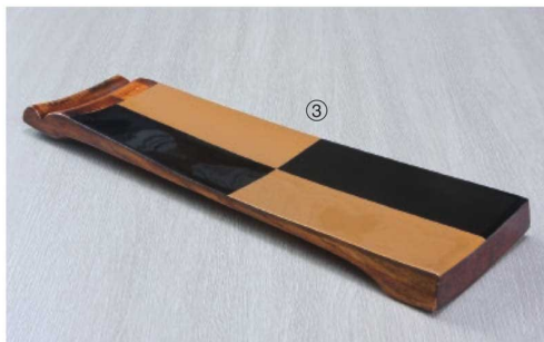
26-268-03 (41513) 樽盛器(黒)(金地市松) ¥20,000 本体寸法: W40xD12xH2.5cm 木/漆塗装