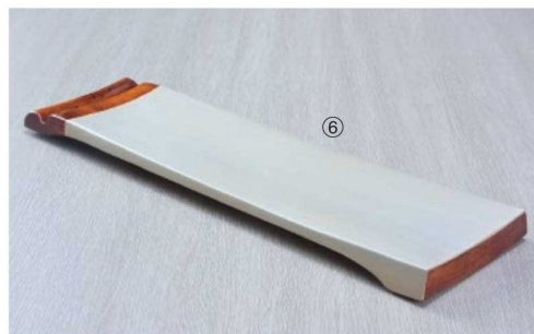
26-268-06 (41613) 樽盛器(おぼろ銀彩) ¥23,000 本体寸法: W40xD12xH2.5cm 木/漆塗装