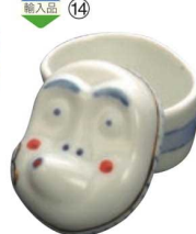
26-298-14 (451054) ヒョットコ珍味入 ¥1,050 本体寸法:W5.5xD5xH4.7cm 陶器