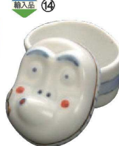
26-298-14 (451054) ヒョットコ珍珠入 ¥1,050 本体寸法: W5.5xD5xH4.7cm 陶器