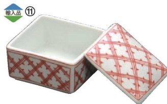
26-298-10 (451085) 赤格子角鉢珍珠入(小) ¥560 本体寸法: W5xD5xH3.5cm 陶器