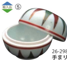
26-298-05 (451048) 手まり珍味入 ¥1,200 本体寸法:Φ6xH5cm 陶器