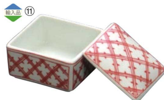
26-298-10 (451085) 赤格子角鉢珍味入(小) ¥560 本体寸法:W5xD5xH3.5cm 陶器