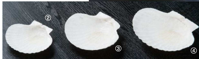
26-298-02 (422411) 天然ほたて貝(小) ¥360 本体寸法: 約Φ10cm 貝