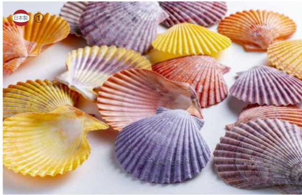
26-298-01 (262060) ヒオウギガイ(片面・10枚) ¥1,800 本体寸法:Φ7~9cm 貝 ※色はアソートです。