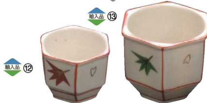
26-298-13 (451064) ボンボリ珍珠入(大) ¥680 本体寸法: Φ6xH4.5cm 陶器