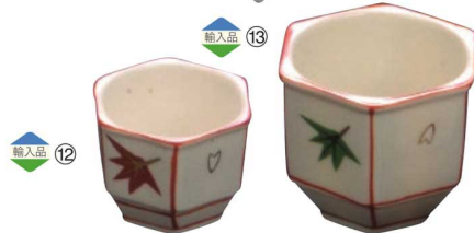
26-298-13 (451064) ボンボリ珍味入(大) ¥680 本体寸法:Φ6xH4.5cm 陶器