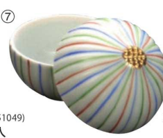
26-298-07 (451050) トクサ珍味入 ¥1,200 本体寸法:Φ6.5xH6.5cm 陶器