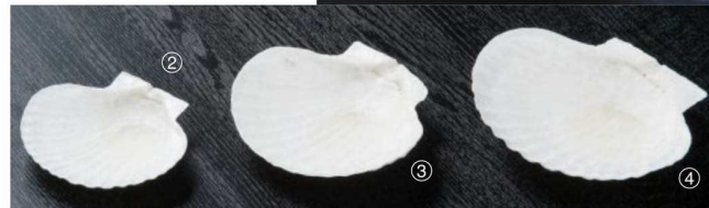
26-298-02 (422411) 天然ほたて貝(小) ¥360 本体寸法:約Φ10cm 貝