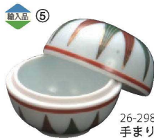
26-298-05 (451048) 手まり珍珠入 ¥1,200 本体寸法: Φ6xH5cm 陶器