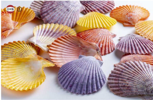
26-298-01 (262060) ヒオウギガイ(片面・10枚) ¥1,800 本体寸法: 約Φ7~9cm 貝 ※色はアソートです。