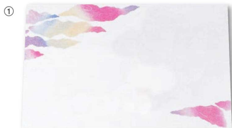
26-311-01 (541151) 抗菌尺三懐石マット(彩雲) ¥5,300 本体寸法: W26.4×D39cm 紙(100枚入)