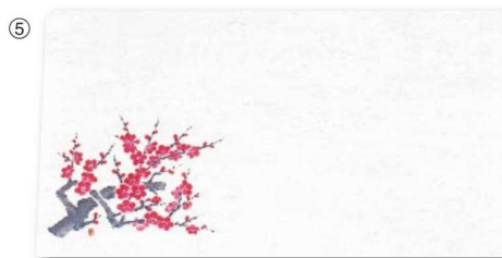
26-311-05 (541155) 抗菌尺三懐石マット(梅) ¥5,300 本体寸法: W26.4×D39cm 紙(100枚入)