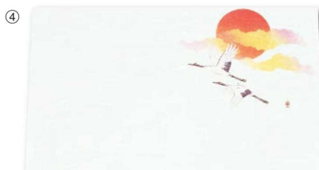
26-311-04 (541154) 抗菌尺三懐石マット(夫婦鶴) ¥5,300 本体寸法: W26.4×D39cm 紙(100枚入)