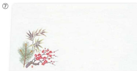
26-311-07 (541157) 抗菌尺三懐石マット(祝・正月) ¥5,300 本体寸法: W26.4×D39cm 紙(100枚入)