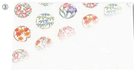
26-311-03 (541153) 抗菌尺三懐石マット(花雅) ¥5,300 本体寸法: W26.4×D39cm 紙(100枚入)