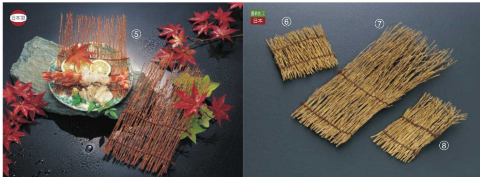
26-322-05 (25154) 岩萩スタレ (上) ¥2,800 本体寸法: W22xD16cm