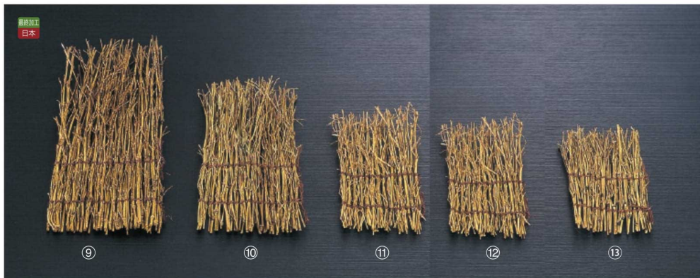
26-322-09 (25109) 小笹皿 (特大) ¥700 本体寸法: W30xD13cm 竹/ウレタン塗装