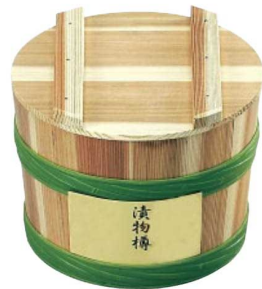
⑧-⑪ ポリプロピレンタガタイプ