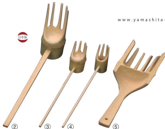
26-352-02 (26233) 青竹めんすくい(A) ¥950 本体寸法:Φ5xH1.5xD30cm 竹