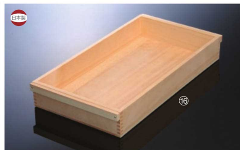
26-352-16 (521496) 餅箱 ¥7,100 本体寸法:W60xD33xH9cm 木