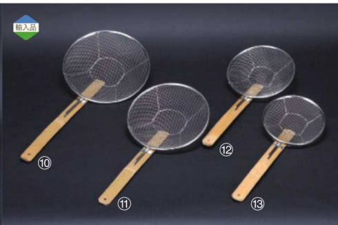
26-352-10 (261264) ステンレスそば揚 (横柄)(大) ¥5,200 本体寸法:Φ27xD60cm 木 ステンレス/ウレタン塗装(全体寸法)