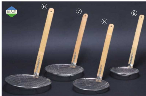
26-352-06 (261304) ステンレスそば揚 (縦柄)(大) ¥5,200 本体寸法:Φ27xD46cm 木 ステンレス/ウレタン塗装(柄の長さ)