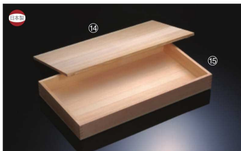
26-352-14 (521494) 番重(蓋) ¥3,400 本体寸法:W56xD34.5xH1cm 木