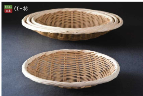
最終加工 日本 ⑪-⑮

26-354-10 (40226) 長角盆ザル(尺5) ¥6,100 本体寸法:W45×D40cm 竹 ステンレス PP