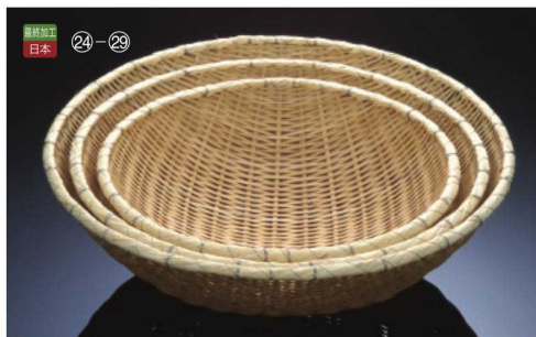
最終加工 日本 ㉓-㉔

26-354-23 (40892C) 溜ザル(尺8) ¥14,000 本体寸法:Φ54xH10cm 竹 ステンレス 籐