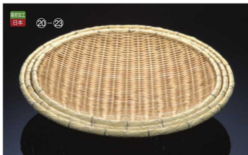
最終加工 日本 ⑳-㉒

26-354-19 (712163A) 盆ザル(深)(並)(尺) ¥3,600 本体寸法:Φ30xH7cm 竹 籐