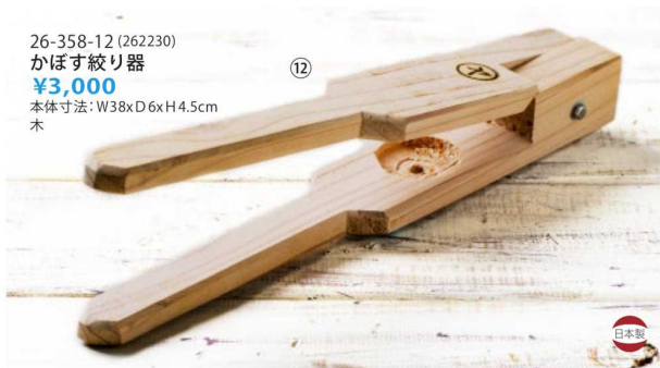
26-358-12 (262230) かぼす絞り器 ¥3,000 本体寸法: W38xD6xH4.5cm 木