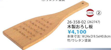
26-358-02 (262747) 木製おろし板 ¥4,100 本体寸法: W24xD9.5xH0.8cm 竹/ウレタン塗装