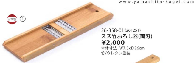
26-358-01 (261251) スス竹おろし器(両刃) ¥2,000 本体寸法: W7.5xD26cm 竹/ウレタン塗装