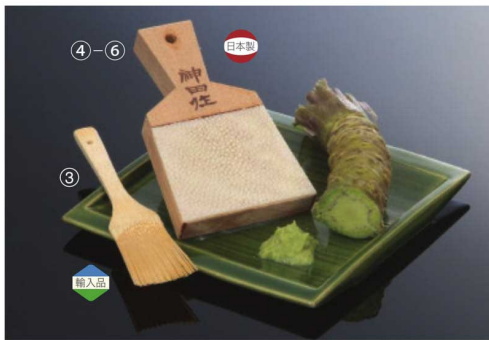
26-358-03 (26299) 白竹ミニハケ ¥290 本体寸法: 13.5cm 竹