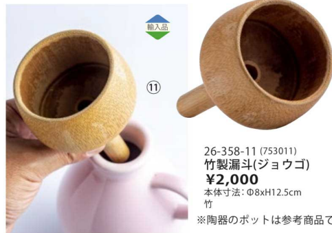
26-358-11 (753011) 竹製漏斗(ジョウゴ) ¥2,000 本体寸法: Ø8xH12.5cm 竹