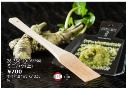
26-358-10 (262256) ミニハケ(上) ¥700 本体寸法: W2.7x13.5cm 竹