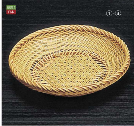
26-431-01 (712306) 鎌倉茶托(煎茶用) ¥2,500 本体寸法:Φ8.5xH3cm 竹