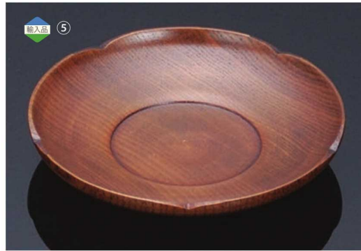
26-431-05 (36297) 梅型茶托 ¥1,000 本体寸法:Φ12xH2cm 木/漆塗装