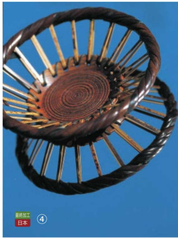
26-431-04 (712521) 藤巻虎筋茶托 ¥3,200 本体寸法:Φ12xH3cm 竹/ウレタン塗装