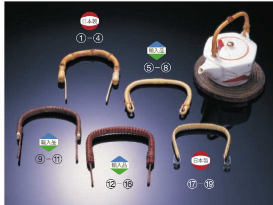
※こちらの商品は天然素材を手作りで制作しております。そのため、各種サイズは前後することがございます。サイズは目安となりますので、予め、ご了承くださいませ。