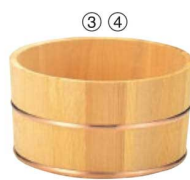
26-566-03 (528342) 榎湯桶 (銅タガ) ¥4,750 本体寸法:Φ23xH11.5cm 木 銅