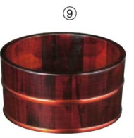
26-566-09 (528346) 榎湯桶 (銅タガ)(樺色) ¥9,400 本体寸法:Φ23xH11.5cm 木 銅 ウレタン塗装