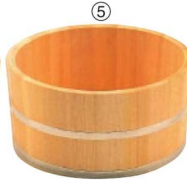
26-566-04 (528343) 榎湯桶 (銅タガ)(紅白) ¥4,600 本体寸法:Φ23xH11.5cm 木 銅