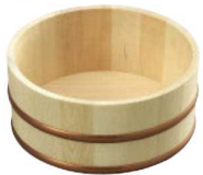
26-566-07(522502) 湯桶(小) ¥2,400 本体寸法:約Φ21xH10cm 木 ポリプロピレン