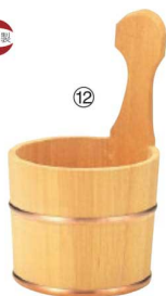
26-566-12 (528348) 榎片手湯桶 (銅タガ) ¥5,550 本体寸法:Φ14.5xH24.5cm 木 銅