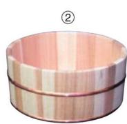
26-566-02 (528341) 杉湯桶 (銅タガ)(紅白) ¥4,000 本体寸法:Φ22xH11.5cm 木 銅