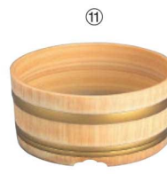
26-566-11 (528350) 樹脂湯桶 ¥3,200 本体寸法:Φ22xH10cm 樹脂