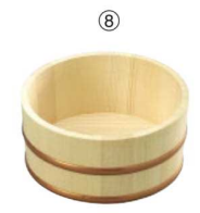
26-566-08(522503) 湯桶(大) ¥2,600 本体寸法:約Φ22.5xH10cm 木 ポリプロピレン