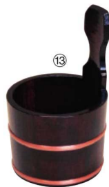
26-566-13 (528349) 榎片手湯桶 (銅タガ)(樺色) ¥8,600 本体寸法:Φ14.5xH24.5cm 木 銅 ウレタン塗装