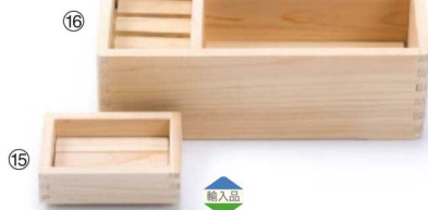
26-566-15 (521542) 檜石けん置 ¥900 本体寸法:W12.5xD8.5xH3.5cm 木