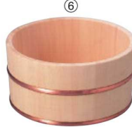
26-566-05 (528344) 榎湯桶 (ステンレスタガ) ¥4,950 本体寸法:Φ23xH11.5cm 木 ステンレス