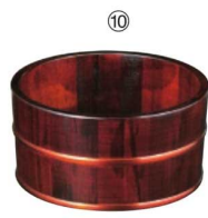
26-566-10 (528347) 榎湯桶 (銅タガ)(樺色) ¥11,000 本体寸法:Φ23xH11.5cm 木 銅 ウレタン塗装