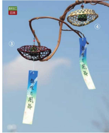
26-601-03 (401114) 大名風鈴(染) ¥3,000 本体寸法:W17xD8xH6cm 竹 鉄 紙(箱入)