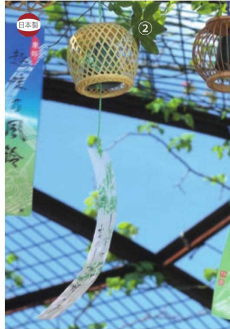
26-601-02 (40102) 白竹風鈴 ¥3,000 本体寸法:Φ8xH8cm 竹 鉄 紙(箱入)