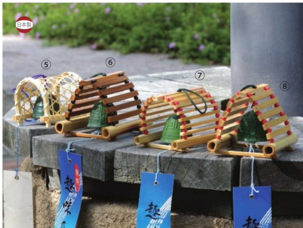
26-601-05 (40334) 屋形風鈴 ¥3,300 本体寸法:W10xD7xH7cm 竹 鉄 紙/ウレタン塗装(箱入)