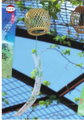
26-601-02 (40102) 白竹風鈴 ¥3,000 本体寸法:Φ8xH8cm 竹 鉄 紙(箱入)