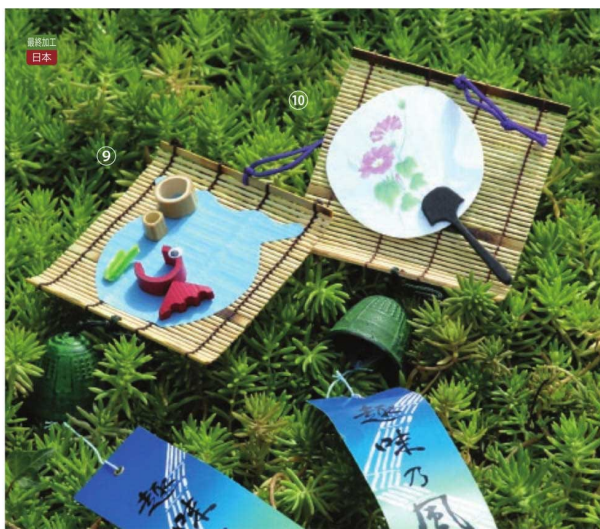
26-601-09 (40414) スタレ金魚風鈴 ¥2,950 本体寸法:W11xD11cm 竹 鉄 紙(箱入)