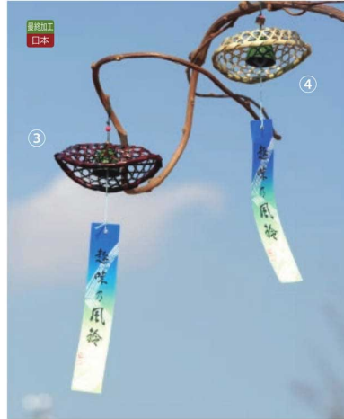
26-601-03 (401114) 大名風鈴(染) ¥3,000 本体寸法:W17xD8xH6cm 竹 鉄 紙(箱入)