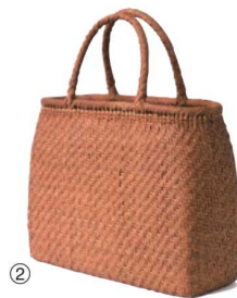
② 26-619-02 (91935) 山葡萄バッグ(F極4) ¥117,000 本体寸法: W31xD11xH24cm 山葡萄 柿渋布(網代編)(沢皮)