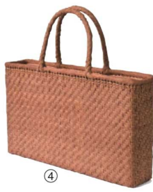
④ 26-619-04 (91937) 山葡萄バッグ(F極7) ¥114,000 本体寸法: W37xD8xH22cm 山葡萄 柿渋布(網代編)(沢皮)