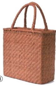
③ 26-619-03 (91936) 山葡萄バッグ(F極5) ¥87,000 本体寸法: W23.5xD11xH23cm 山葡萄 柿渋布(網代編)(沢皮)