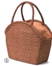
⑤ 26-619-05 (91938) 山葡萄バッグ(F極8) ¥95,000 本体寸法: W23xD13xH24.5cm 山葡萄 柿渋布(網代編)(沢皮)