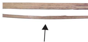
玻璃の籠バッグ用3mm幅ヒゴ (上は通常の山葡萄バッグに使用されるヒゴです)