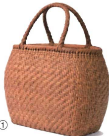
① 26-619-01 (91934) 山葡萄バッグ(F極3) ¥87,000 本体寸法: W22xD10xH21cm 山葡萄 柿渋布(網代編)(沢皮)