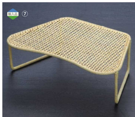
07 (425003) 籐正座イス ¥5,000 本体寸法: W41xD28xH13cm 籐 鉄