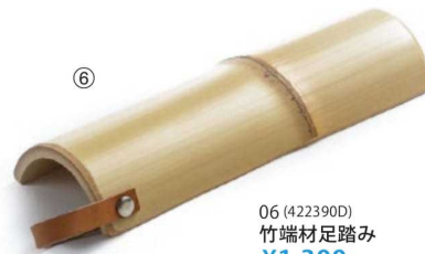
06 (422390D) 竹端材足踏み ¥1,300 本体寸法: 約20cm 竹 ※革ひもはアソート