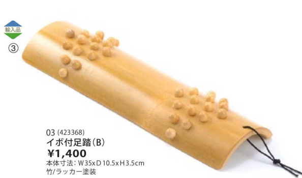
03 (423368) イボ付足踏 (B) ¥1,400 本体寸法: W35xD10.5xH3.5cm 竹/ラッカー塗装