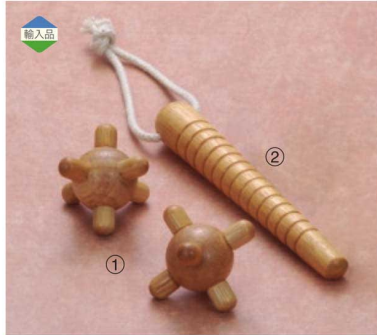
01 (425004) くるみもどき (2P) ¥570 本体寸法: Φ4cm 木/ラッカー塗装