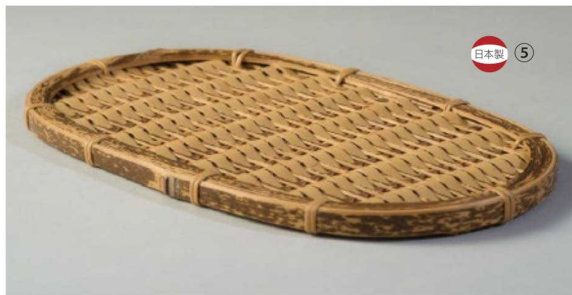
26-662-04 (184032) 六つ目折返盛器 ¥14,000 本体寸法:Φ39xH7cm 竹