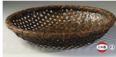
26-662-01 (420730) 茜麻の葉色紙掛 ¥17,000 本体寸法: Φ45cm 竹(箱入)