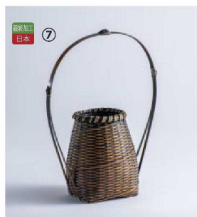
26-662-06 (711402) 染六つ目投げ入籠 ¥9,500 本体寸法: Φ14xH39(24)cm 竹