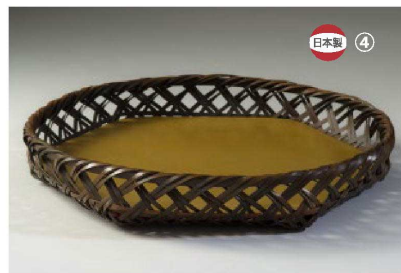
26-662-02 (184033) 磨亀甲盛皿 ¥82,000 本体寸法: Φ46xH9cm 竹/漆塗装(箱入)