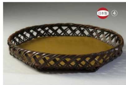
26-662-03 (184031) 荒編み水盤 ¥24,000 本体寸法:Φ35xH21cm 竹