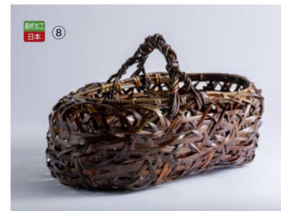
26-662-07 (711406) 磨ビク手付花入 ¥9,800 本体寸法:W16xD8xH23(11)cm 竹