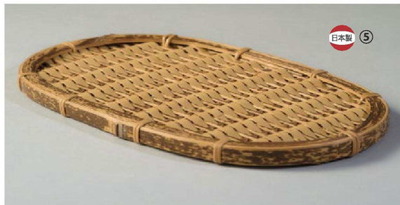
26-662-03 (184031) 荒編み水盤 ¥24,000 本体寸法: Φ35xH21cm 竹