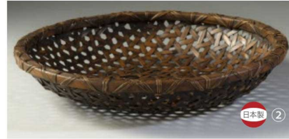
26-662-01 (420730) 苜麻の葉色紙掛 ¥17,000 本体寸法:Φ45cm 竹(箱入)