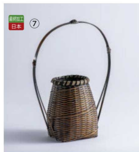
26-662-06 (711402) 染六ツ目投げ入籠 ¥9,500 本体寸法:Φ14xH39(24)cm 竹