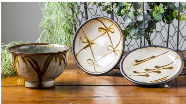
26-088-08 (453437) 小代焼汁碗 ¥3,200 本体寸法: Φ11.5x7.5cm 陶器