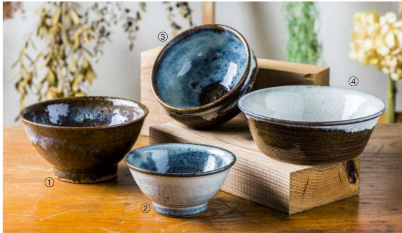
26-088-01 (453316) 小代焼小どんぶり ¥3,800 本体寸法: Φ14.3xH7.5cm 陶器