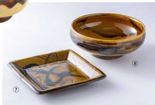
26-092-07(451905) 龍門司焼 角皿 ¥7,200 本体寸法: W16xD16xH2cm 陶器