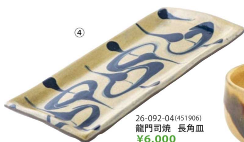
26-092-04(451906) 龍門司焼 長角皿 ¥6,000 本体寸法: W21.5xD9.5xH1cm 陶器