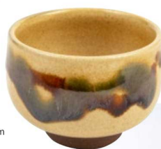
26-092-05(456119) 龍門司焼 ころ湯呑 A ¥1,700 本体寸法: Φ6.5xH5cm 陶器