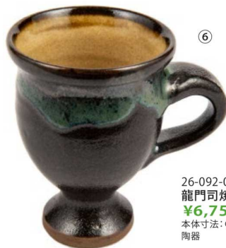
26-092-06(456126) 龍門司焼 マグカップ ¥6,750 本体寸法: Φ7.2xH9.5cm 陶器