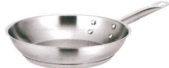
⑧ KYS NEWPRO IHフライパン [AFPA-01] IH