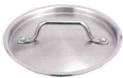
⑦ KYS NEWPRO 鍋蓋 [AFTA-01]