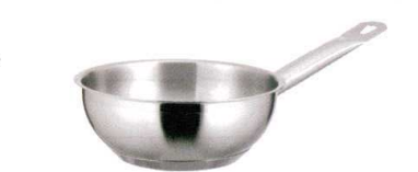
⑥ KYS NEWPRO IHコニカルパン [ACON-01] IH