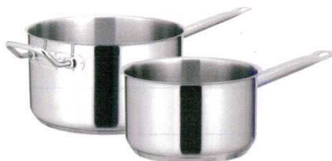
④ KYS NEWPRO IH片手深型鍋 (蓋無) [AKFA-01] IH