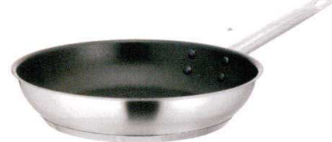
⑨ KYS NEWPRO IHエクスカリバーフライパン [AFPA-02] IH