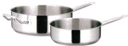
⑤ KYS NEWPRO IH片手浅型鍋 (蓋無) [AKAA-01] IH