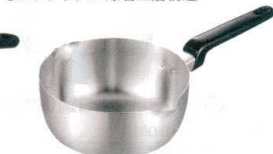
⑮ エレックマスター ライト 雪平鍋