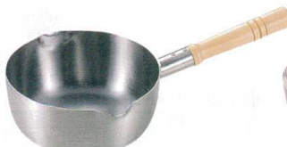
⑪ 20-0 ロイヤル 雪平鍋