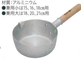
⑦ アルミ 深型 ゆきひら鍋