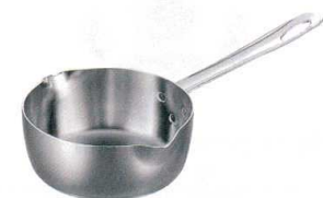
⑯ エレックマスタープロ 雪平鍋