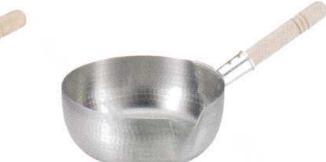
② アカオDON 雪平鍋 カラス口(ビス止め)