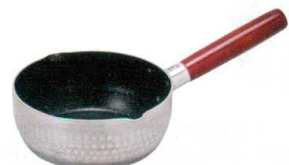
⑩ マーブルミラー IH対応 アルミ雪平鍋