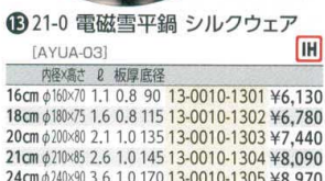
⑬ 21-0 電磁雪平鍋 シルクウェア