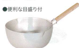
⑤ アルミ 打出雪平鍋 [AYUB-08]