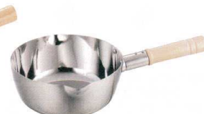
⑫ 21-0 電磁雪平鍋 ミラー仕上