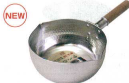
⑦ 和の職人 IH ゆきひら鍋