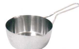
④ 越乃 IH ゆきひら鍋