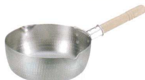
① アカオDON 雪平鍋(ビス止め)