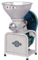
4 こだま号万能機 K2-BMS (M) (全アタッチ付) [EBNK-01] ㊦

13-0102-0301 ¥8,500 サイズ: 245×250×H360 ホッパーサイズ: 236×167 最大容量: 5.4ℓ (3升) 重量: 1.2kg カラー: ホワイト(W) ●つきたてのお餅がくっつきにくい、「フツ素加工」のナイフ ●一度に5.4ℓ (3升)のお餅が入る大容量ホッパー ●吸着盤つきスタンド