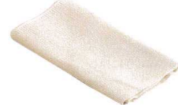
16 ホテイ印 純綿モチフキン (5枚入) [AMTF-03] ㊦

13-0102-1501 ¥5,600 サイズ: 外寸/φ506×H72 内寸/φ480×H70 容量: 15ℓ