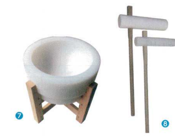
7 PC臼(木台付) [EMUS-04] ㊦

サイズ 重量(kg) 大 φ118×350×H850 3.5 13-0102-0601 ¥22,700 小 φ85×332×H850 1.8 13-0102-0602 ¥17,700 ※杵の形状は頭部が角型になる事もあります。