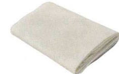
17 ホテイ印 テトロン モチフキン (5枚入) [AMTF-05]

サイズ 大 780×750 13-0102-1601 ¥8,500 小 640×620 13-0102-1602 ¥6,200 材質: 綿100% ●生地離れが良く、使いやすい。