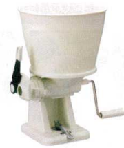
3 タイガー 餅切り(まる餅くん) SMX-5401 [EMCT-01] ㊦

13-0102-2001 ¥44,500 サイズ: 454×312×H350 電源: 単相100V 50/60Hz 消費電力: モーター/230W (50Hz)・260W (60Hz) ヒーター/830W もちつき可能量: 3.6ℓ (2升) 重量: 10.5kg