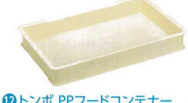
12 トンボ PPフードコンテナ [ABJC-05] ㊦

サイズ フードコンテナ用 360×560 13-0102-1101 ¥1,000 のし板用 880×1,200 13-0102-1102 ¥3,000 材質: ポリプロピレン(耐熱100°C) ●もちがくっつきにくく、コンテナの後片づけも楽になります。