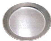
15 アルミ もちとり盆 48cm シルバー [AMTB-02]

13-0102-1501 ¥5,600 サイズ: 外寸/φ506×H72 内寸/φ480×H70 容量: 15ℓ