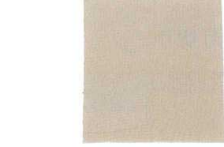
18 ホテイ印 まんじゅう蒸しふきん 厚地 [AMTF-04] ㊦

13-0102-1701 ¥9,800 サイズ: 700×700 ●耐熱性、生地の変色に強いテトロン糸製。