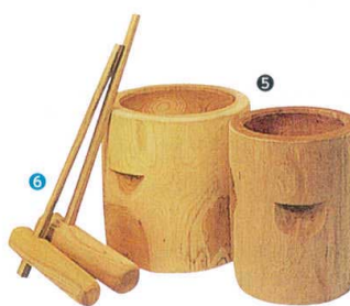
5 臼(ウス) (国産ケヤキ材) [EMUS-01] ㊦

13-0102-0401 ¥134,000 サイズ: 390×480×H670 重量: 30kg 電源: 単相100V 50/60Hz 消費電力: 400W ホイッパー容量: 13ℓ φ360 能力: 製餅4.2kg (3升)/5分 製粉6~50kg/時間 味噌すり・大豆200kg/時間 ●1台で多目的にご利用頂ける多機能タイプです。