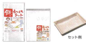
11 PP もちもちシート [AMTS-01] ㊦

13-0102-1001 ¥22,500 サイズ: 540×230×H160 刃渡り: 260