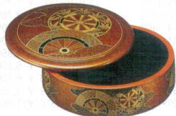
⑤ (福)7.5寸 DX特上桶 梨地御所車 [RSSO-15] W サイズ 本体 φ228×H63 13-1071-0501 ¥2,500 蓋 φ224×H21 13-1071-0502 ¥2,200 材質:ABS樹脂