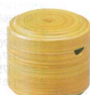
⑮ (福)つつ型粉茶入れ [RCHI-01] W 梨地 13-1071-1501 ¥1,600 黒乾漆 13-1071-1502 ¥1,650 白木 13-1071-1503 ¥1,700 サイズ:φ70×H60 材質:熱硬化特殊樹脂