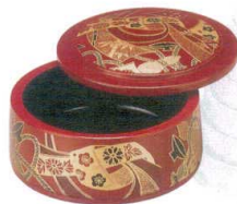
② (若)DX富士型ちらし桶 朱に結び [RSSO-09] W 13-1071-0201 ¥1,700 サイズ:φ160×H85 材質:ABS樹脂