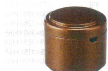
⑬ (若)ショージュ差し 黒 [QSYS-02] W 13-1071-1301 ¥2,200 サイズ:115×62×H90 材質:アクリル樹脂