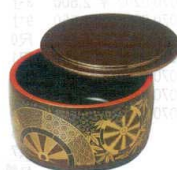
⑥ (若)DX4寸タイコミニ桶 梨地御所車内黒塗 [RSSO-16] W 洗 サイズ 本体(深型) φ117×H63 13-1071-0601 ¥850 蓋 φ117×H12 13-1071-0602 ¥600 材質:耐熱ABS樹脂