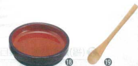
⑱ (若)DXタレ入れ 朱天黒 [RTRI-15] W 13-1071-1801 ¥480 サイズ:φ94×H24 材質:ABS樹脂