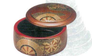
① (若)DXタイコちらし桶 金梨地御所車 [RSSO-04] W 13-1071-0101 ¥2,400 サイズ:φ160×H90 材質:ABS樹脂