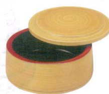
③ (若)DX富士型ちらし桶 白木 [RSSO-10] W 13-1071-0301 ¥1,650 サイズ:φ160×H85 材質:ABS樹脂