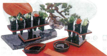
⑨ (若)手巻きすし立て 3本用 黒測朱 [RSUT-01] W 13-1071-0901 ¥1,350 サイズ:178×80×H83 材質:ABS樹脂