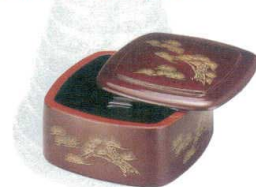
④ (若)DX角ちらし桶 溜パール老松 [RSSO-06] W 13-1071-0401 ¥2,050 サイズ:150×150×H85 材質:ABS樹脂