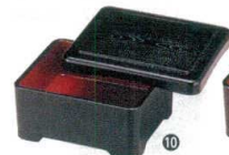
⑩ (若)耐熱井重 新木目 黒内朱塗 [RDNJ-03] W 画 6 13-1082-1001 ¥1,750 サイズ:168×143×H78 材質:耐熱ABS樹脂