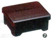
⑦ (福)耐熱木目井重 溜内朱 [RDNJ-10] W 画 6 13-1082-0701 ¥2,200 サイズ:168×143×H72 内寸:148×123×H47 材質:耐熱ABS樹脂