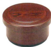
⑰ (若)保温飯器 木目 (ヘラ付) [SSMS-06] W 画 6 サイズ 2人用 φ225×H130 13-1082-1701 ¥5,150 3人用 φ252×H140 13-1082-1702 ¥5,850 5人用 φ280×H157 13-1082-1703 ¥7,300 材質:ABS樹脂 ●オヤ・フタとも発泡ウレタン注入により約1.5時間 さめませんので、ごはんがいつまでも温かく召し 上がれます。