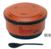
⑱ (若)いずみ飯器 根来 [SSMS-26] W 画 6 サイズ 1人用(ヘラなし) φ150×H 70 13-1082-1801 ¥1,500 2人用(ヘラ付) φ180×H100 13-1082-1802 ¥2,720 3人用(ヘラ付) φ223×H125 13-1082-1803 ¥3,700 5人用(ヘラ付) φ270×H135 13-1082-1804 ¥4,900 10人用(ヘラ付) φ322×H170 13-1082-1805 ¥7,850 材質:ABS樹脂