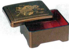
③ (福)光月井重 梨地 ひょうたん [RDNJ-06] W 画 6 13-1082-0301 ¥1,980 サイズ:167×143×H80 内寸:143×119×H46 材質:ABS樹脂