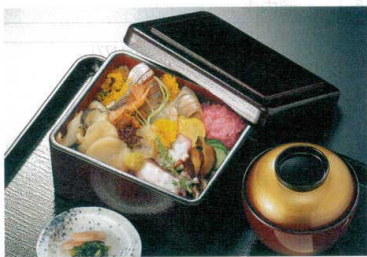
⑭ 摺り漆 木製飯器セット [SHNK-01] B サイズ 大 25782 φ175×H95 13-1082-1401 ¥9,500 中 25892 φ140×H95 13-1082-1402 ¥6,200 ●しゃもじ付