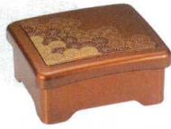
② (福)光月井重 梨地野菊 内朱 [RDNJ-05] W 画 6 13-1082-0201 ¥1,950 サイズ:167×143×H80 内寸:143×119×H46 材質:ABS樹脂