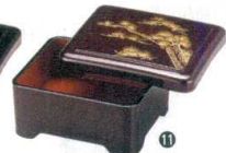
⑪ (若)象足井重 溜老松内朱塗 (フタのみ柄入) [RDNJ-02] W 画 6 13-1082-1101 ¥1,650 サイズ:168×143×H76 材質:ABS樹脂