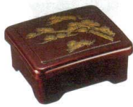
① (福)光月井重 溜パール松 内朱 [RDNJ-04] W 画 6 13-1082-0101 ¥1,900 サイズ:167×143×H80 内寸:143×119×H46 材質:ABS樹脂