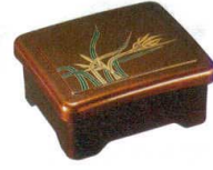
⑤ (福)光月井重 梨地蘭 内朱 [RDNJ-08] W 画 6 13-1082-0501 ¥1,900 サイズ:167×143×H80 内寸:143×119×H46 材質:ABS樹脂