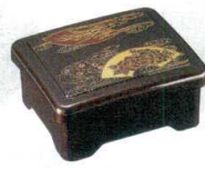
④ (福)光月井重 扇面菊水 内朱 [RDNJ-07] W 画 6 13-1082-0401 ¥1,950 サイズ:167×143×H80 内寸:143×119×H46 材質:ABS樹脂