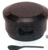
⑯ (若)いずみ飯器 溜 [SSMS-25] W 画 6 サイズ 1人用(ヘラなし) φ150×H 70 13-1082-1601 ¥1,450 2人用(ヘラ付) φ180×H100 13-1082-1602 ¥2,570 3人用(ヘラ付) φ223×H125 13-1082-1603 ¥3,450 5人用(ヘラ付) φ270×H135 13-1082-1604 ¥4,750 10人用(ヘラ付) φ322×H170 13-1082-1605 ¥7,800 材質:ABS樹脂