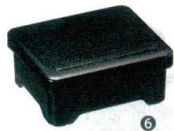
⑥ (福)耐熱木目井重 黒内朱 [RDNJ-09] W 画 6 13-1082-0601 ¥1,900 サイズ:168×143×H72 内寸:148×123×H47 材質:耐熱ABS樹脂