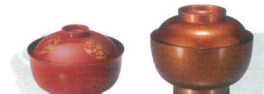
22 (福) 4.5寸 ゆり型雑煮碗 朱内黒四君子 [SSWN-52] W

13-1085-1801 ¥550 サイズ: φ105×H68 容量: 330ml 材質: ABS樹脂