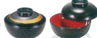
24 (若) 4.5寸 仙才雑煮碗 黒一筆 [SSWN-50] W

13-1085-2001 ¥350 サイズ: φ117×H61 容量: 350ml 材質: ABS樹脂