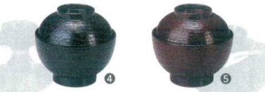
4 (福) ケヤキ小吸椀 黒 [SSWN-39] W

13-1085-2103 ¥480 サイズ: φ108×H70 容量: 320ml