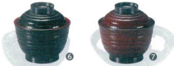
6 (福) 3.5寸 乱引木目小吸椀 黒内朱 [SSWN-41] W

13-1085-2301 ¥2,100 サイズ: φ132×H116 容量: 630ml 材質: 耐熱ABS樹脂