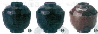
1 (福) 亀甲小吸椀 黒 [SSWN-36] W

13-1085-0101 ¥580 サイズ: φ97×H99 容量: 295ml 材質: ABS樹脂