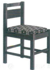
3 和風椅子 阿山B ブラック [UISA-03] 目 価

1155-1864(黒レザー) 13-1111-0201 ¥25,000 1155-1865(赤レザー) 13-1111-0202 ¥25,000 1155-1867(カスリレザー) 13-1111-0203 ¥25,000