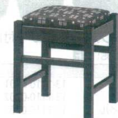
6 和風椅子 弥山B ブラック [UISA-23] 目 価

1193-1738(黒レザー) 13-1111-0501 ¥18,300 1193-1739(赤レザー) 13-1111-0502 ¥18,300 1193-1740(カスリレザー) 13-1111-0503 ¥18,300