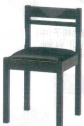
9 和風椅子 関羽B ブラック [UISA-12] 目 価

1206-1899(黒レザー) 13-1111-0801 ¥22,100 1206-1900(茶レザー) 13-1111-0803 ¥22,100