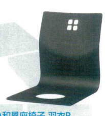
14 和風座椅子 羽衣B ブラック 8243 [UISA-19] 目 価

13-1111-1301 ¥6,800 サイズ:370×530×H440 主材:カバ