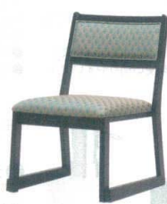
11 高脚座椅子(スタッキング式) 喜楽35N ブラック [UISA-20] 目 価

13-1111-1001 ¥25,000 サイズ:440×500×H710 主材:ゴムの木 座高:350 ●量に優しいスタッキングチェアー