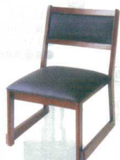
12 高脚座椅子(スタッキング式) 喜楽35B ブラウン [UISA-18] 目 価

13-1111-1101 ¥24,000 サイズ:440×500×H710 主材:ゴムの木 座高:350 ●量に優しいスタッキングチェアー