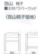
弥山 椅子 ■主材/ラバーウッド 〈弥山椅子張地〉 450 360 300

1393-1738(黒レザー) 13-1111-0601 ¥18,300 1393-1739(赤レザー) 13-1111-0602 ¥18,300 1393-1740(カスリレザー) 13-1111-0603 ¥18,300