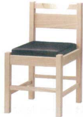
1 和風椅子 阿山N ナチュラルクリア [UISA-01] 目 価

1055-1864(黒レザー) 13-1111-0101 ¥25,000 1055-1865(赤レザー) 13-1111-0102 ¥25,000 1055-1867(カスリレザー) 13-1111-0103 ¥25,000