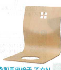
13 和風座椅子 羽衣N ナチュラルクリア 8241 [UISA-24] 目 価

13-1111-1201 ¥24,000 サイズ:440×500×H710 主材:ゴムの木 座高:350 ●量に優しいスタッキングチェアー