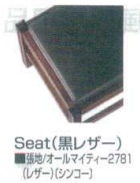
Seat(黒レザー) ■張地/オールマイティ2781 (レザー)〈シンコー〉