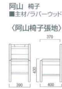
阿山 椅子 ■主材/ラバーウッド 〈阿山椅子張地〉 370 450 390 400

1355-1864(黒レザー) 13-1111-0301 ¥25,000 1355-1865(赤レザー) 13-1111-0302 ¥25,000 1355-1867(カスリレザー) 13-1111-0303 ¥25,000