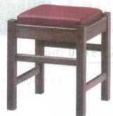
5 和風椅子 弥山D ダークブラウン [UISA-22] 目 価

1093-1738(黒レザー) 13-1111-0401 ¥18,300 1093-1739(赤レザー) 13-1111-0402 ¥18,300 1093-1740(カスリレザー) 13-1111-0403 ¥18,300