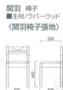
関羽 椅子 ■主材/ラバーウッド 〈関羽椅子張地〉 350 450 400 400

1306-1899(黒レザー) 13-1111-0901 ¥22,100 1306-1900(茶レザー) 13-1111-0903 ¥22,100