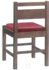
2 和風椅子 阿山D ダークブラウン [UISA-02] 目 価

1055-1864(黒レザー) 13-1111-0101 ¥25,000 1055-1865(赤レザー) 13-1111-0102 ¥25,000 1055-1867(カスリレザー) 13-1111-0103 ¥25,000