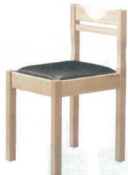
7 和風椅子 関羽N ナチュラルクリア [UISA-10] 目 価

1006-1899(黒レザー) 13-1111-0701 ¥22,100 1006-1900(茶レザー) 13-1111-0703 ¥22,100