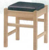
4 和風椅子 弥山N ナチュラルクリア [UISA-21] 目 価

1093-1738(黒レザー) 13-1111-0401 ¥18,300 1093-1739(赤レザー) 13-1111-0402 ¥18,300 1093-1740(カスリレザー) 13-1111-0403 ¥18,300