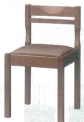
8 和風椅子 関羽D ダークブラウン [UISA-11] 目 価

1006-1899(黒レザー) 13-1111-0701 ¥22,100 1006-1900(茶レザー) 13-1111-0703 ¥22,100