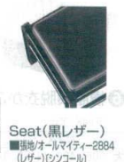
Seat(黒レザー) ■張地/オールマイティ2884 (レザー)〈シンコー〉