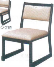
10 高脚座椅子(スタッキング式) 喜楽35S 古木色 [UISA-17] 目 価

13-1111-1001 ¥25,000 サイズ:440×500×H710 主材:ゴムの木 座高:350 ●量に優しいスタッキングチェアー