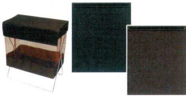
④ サイドワゴン用 フタ [QBRS-04] L