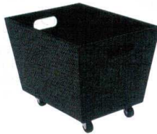
⑤ バッグレスト(キャスター付) TM-P [QBRS-05] ◇F