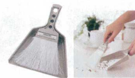
⑮ MMテーブルホークセット [QTBH-01] G