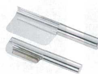
⑭ UK18-8 ダストパン [UDPN-03]