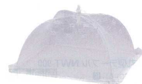
⑪ ホワイト 食卓カバー [QLUM-47]