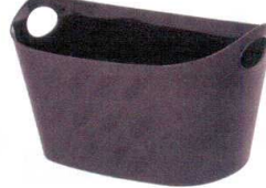
⑩ オーバル収納バスケット [QCBS-03] S