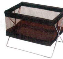
③ サイドワゴン L ZSK-R-330