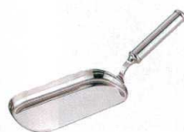
⑬ UK18-8 ダストパン (ステンレスハンドル) [UDPN-02]