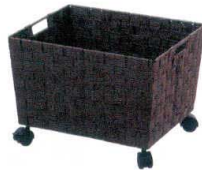
⑧ クロークバスケット スクエア (キャスター付) [QCBS-01] S