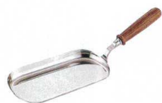
⑫ UK18-8 木柄ダストパン [UDPN-01]