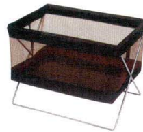
② サイドワゴン M ZSK-R-350