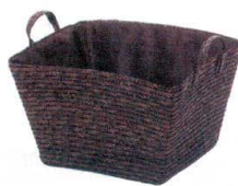
⑨ クロークバスケット ストロー [QCBS-02] S