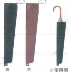
黒 茶 ※使用例