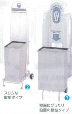
スリムな縦型タイプ