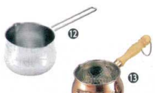
12 18-8 目盛付ミルクパン [AMKA-01] 内径×高さ 800ml 120×H83 13-0014-1201 ¥3,000 1,000ml 143×H90 13-0014-1202 ¥3,400 ●目盛付(100ml単位)