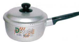
3 ドリーム 片手鍋 [AKFB-06] 内径×深さ ℓ kg 16cm 160×79 1.6 0.37 13-0014-0301 ¥3,000 18cm 180×90 2.4 0.44 13-0014-0302 ¥3,300 20cm 200×100 3.2 0.50 13-0014-0303 ¥3,600 板厚:1.3