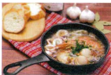
15 鉄鋳物製スキレット [AFPC-13] IH 外径×深さ kg 12cm 140×H39 約0.6 13-0014-1501 ¥1,320 13cm 155×H40 約1.1 13-0014-1507 ¥1,200 15cm 165×H42 約0.9 13-0014-1503 ¥1,760 16cm 175×H50 約1.1 13-0014-1508 ¥1,500 18cm 200×H47 約1.6 13-0014-1505 ¥2,740 20cm 215×H60 約1.2 13-0014-1509 ¥2,100 材質:鉄鋳物 ●鉄鋳物製で蓄熱性に優れ、食卓へそのまま出してもあったか長持ち。 ●保温性が高く冷めにくい鉄鋳物製です。 ●ガス、IH、オープン調理ができます。 ※IH機種により12cmは使用不可の場合があります。