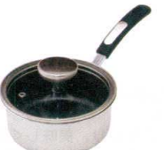
9 ストリール ステンレス ミルクパン 14cm [AMKA-04] IH 13-0014-0901 ¥3,390 サイズ:全長300×150×105 底径:φ120 重量:725g 材質:本体/ステンレス鋼・アルミニウム(2層鋼) ハンドル/シリコン 本体内面/フッ素樹脂塗膜加工 ●焦げ付きにくく、耐久性に優れたフッ素コーティング中身が確認できるガラス蓋付