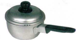
8 ミルクパン 14cm [ASVM-04] 13-0014-0801 ¥2,000 外径×深さ:152×75 容量:1.1ℓ 重量:0.25kg 材質:本体/アルミニウム合金(アルマイト加工) ハンドル・ツマミ/フェノール樹脂