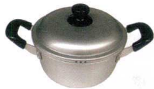
5 両手鍋 [ASVM-01] 外径×深さ ℓ kg 18cm 194×90 2.1 0.38 13-0014-0501 ¥2,900 20cm 214×100 2.9 0.47 13-0014-0502 ¥3,200 22cm 234×110 3.9 0.54 13-0014-0503 ¥3,900 24cm 254×120 5.1 0.61 13-0014-0504 ¥4,200 材質:本体/アルミニウム合金(アルマイト加工) ハンドル・ツマミ/フェノール樹脂