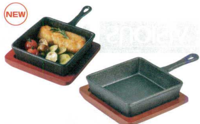
18 スプラウト 鉄鋳物製角型スキレット13×13cm [AFPC-19] IH IH 13-0014-1801 ¥1,800 サイズ:全長235×135×H40 木製プレート160×150×H15 材質:本体/鉄鋳物 木製プレート/天然木 ●保温性が高く冷めにくい鉄鋳物製です。 ●ガス、IH、オープン調理ができます。