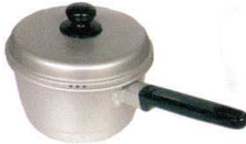
6 兼用鍋 24cm [ASVM-02] 13-0014-0601 ¥5,900 外径×深さ:266×142 容量:7.1ℓ 重量:0.73kg 材質:本体/アルミニウム合金(アルマイト加工) ハンドル・ツマミ/フェノール樹脂