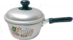
4 ドリーム ミルクパン 14cm [AMKB-04] 13-0014-0401 ¥2,800 内径×深さ:140×73 容量:1.1ℓ 板厚:1.3 重量:0.30kg