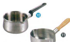
10 フジノス ミルクパン [AMKA-02] IH 13-0014-1001 ¥5,000 サイズ:φ130×H85 容量:1.1ℓ