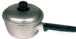
7 片手鍋 [ASVM-03] 外径×深さ ℓ kg 16cm 174×80 1.5 0.31 13-0014-0701 ¥2,200 18cm 194×90 2.1 0.37 13-0014-0702 ¥2,800 20cm 214×100 2.9 0.46 13-0014-0703 ¥3,100 材質:本体/アルミニウム合金(アルマイト加工) ハンドル・ツマミ/フェノール樹脂