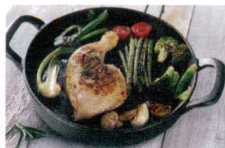
16 イシガキ 鉄鋳物スキレット 両手 [AFPC-13] IH 外径×深さ kg 15cm 158×48 約0.9 13-0014-1601 ¥1,920 18cm 187×50 約1.25 13-0014-1602 ¥2,640 ●鉄鋳物製で蓄熱性に優れ、食卓へそのまま出してもあったか長持ち。