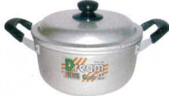
2 ドリーム両手鍋 [ARYT-08] 内径×深さ ℓ kg 20cm 200×100 3.2 0.51 13-0014-0201 ¥3,800 22cm 220×107 4.2 0.63 13-0014-0202 ¥4,200 板厚:1.3