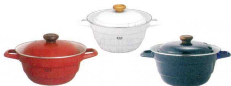
14 ビームス 多機能鍋オールインワン [ABMS-05] G IH [内] ℓ kg レッド ホワイト ネイビー 24cm 3.6 1.85 13-0014-1401 ¥5,000 27cm 5.4 2.20 13-0014-1404 13-0014-1405 13-0014-1406 ¥6,000 サイズ:24cm/335×255×H170 27cm/350×275×H190 材質:本体・フタ/鋳物ホーロー ツマミ/チーク材 付属品:スノコ ●ゆでる・煮る・蒸す・揚げることができます。 ※IH200Vでの揚げ物調理は不可です。