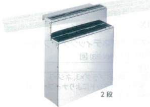
② KYS18-0 包丁差し 流し型(大)

サイズ 1段 333×53×H372 13-0143-0101 ¥ 9,600 2段 333×107×H372 13-0143-0102 ¥12,800 ゴム板切り込みサイズ:288×10