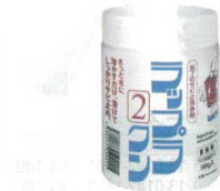
⑫ ラップラック錆洗浄剤 500g入 [CHUS-34] E

13-0143-1201 ¥2,600 ●洗うだけで錆と細菌から包丁を守ります。 ●ウイルスに有効な界面活性剤配合でウイルス消毒にもお使いいただけます。 ●無味無臭で有害物質を含んでいません。