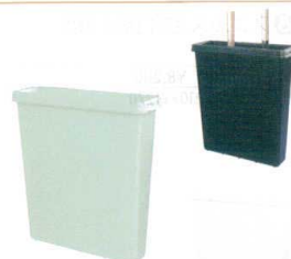
⑦ ラップラック包丁差し (新大型) [CHUS-05] E

ペパーミントグリーン 13-0143-0701 ¥9,700 アイボリー 13-0143-0702 ¥9,700 ブラック 13-0143-0703 ¥9,700 サイズ:355×115×H395 最長刃渡り:365 保管本数:8本 付属金具:壁掛金具 ラップラック使用量:付属スプーン5杯