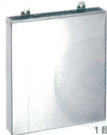
① KYS18-0 包丁差し 釘式(大)