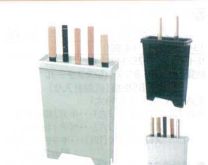
⑧ ラップラック包丁差し (小型) [CHUS-06] E

ペパーミントグリーン 13-0143-0701 ¥9,700 アイボリー 13-0143-0702 ¥9,700 ブラック 13-0143-0703 ¥9,700 サイズ:355×115×H395 最長刃渡り:365 保管本数:8本 付属金具:壁掛金具 ラップラック使用量:付属スプーン5杯