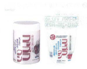
⑩ ラップラック錆止め剤 500g入 [CHUS-08] E 抗菌

置型金具 大型用 13-0143-0901 ¥1,600 置型金具 小型用 13-0143-0902 ¥1,600 流し掛金具 大・小兼用 13-0143-0903 ¥1,000 壁掛け金具 大・小兼用 13-0143-0904 ¥1,150 材質:ステンレス