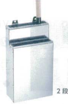
③ KYS18-0 包丁差し 1段 釘式(小)

サイズ 1段 333×53×H372 13-0143-0201 ¥10,200 2段 333×107×H372 13-0143-0202 ¥13,400 流し掛部サイズ:45 ゴム板切り込みサイズ:288×10