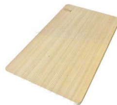
⑤ 樹婦人S薄口まな板 (幅広・反り止付) [CMNH-06]