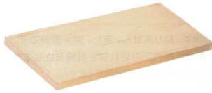
① 桧 まな板 [CMNH-01]