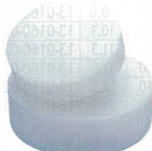
⑦ 住友 プラスチック中華まな板 [CMNB-12]

●縦と横に滑り止めシボ付き。 ●硬質ポリエチレン製で強度的に優れており軽量です。