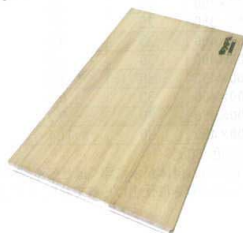
④ 桐まな板(きり子さん) 幅広薄厚 [CMNH-05]

●全面にフッ素樹脂抗菌加工を施してあるので、変色しにくく雑菌の付着、繁殖がしにくいです。