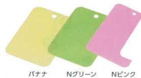
バナナ Nグリーン Nピンク バニラ