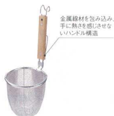
2 TSステンレス 木柄 てぼ 丸底(18-8アミ・8メッシュ) [ATBA-19] E 13-0164-0201 ¥3,200 サイズ：φ140×H150×柄長210