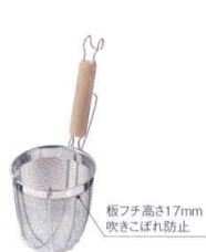
1 TSステンレス 丸木柄 うどんてぼ(18-8アミ・8メッシュ) [ATBA-21] E 13-0164-0101 ¥2,650 サイズ：φ140×H160×柄長185