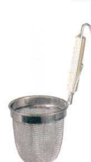
4 フジボシ18-8 木柄 うどんてぼ (10メッシュ) [ATBA-01] 13-0164-0401 ¥3,250 サイズ：φ140×H150×柄長200