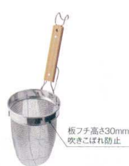
9 TSステンレス ケヤキ柄 深型うどん揚(8メッシュ) [ATBA-05] E 13-0164-0901 ¥3,100 サイズ：φ140×H185×柄長205