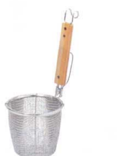
3 TSステンレス 木柄 てぼ 平底(18-8アミ・8メッシュ) [ATBA-20] E 13-0164-0301 ¥3,200 サイズ：φ140×H130×柄長210