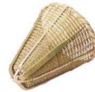
9 竹製 振りザル(柄なし) [ATBA-36]

サイズ S 115×180×H 85 13-0166-0801 ¥ 9,200 L 115×180×H140 13-0166-0802 ¥10,500 柄長:185