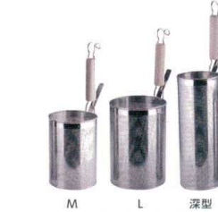
12 UK18-8 木柄パンチング スパゲティてぼ(穴径1.5mm) [ATBC-02]

サイズ 底丸 φ140×H180 13-0166-1101 ¥3,100 底平 φ140×H200 13-0166-1102 ¥4,800 柄長:215