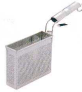
3 UK18-8 パイプ柄パンチング冷凍麺てぼ [ATBB-04]

サイズ 特大 φ193×H150 13-0166-0201 ¥4,250 大 φ173×H140 13-0166-0202 ¥3,550 中 φ153×H130 13-0166-0203 ¥3,180 小 φ139×H125 13-0166-0204 ¥2,840 柄長:特大/170 大/165 中・小/160