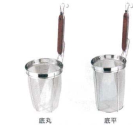
11 18-8 木柄ラーメン・パスタ揚げ (16メッシュ) [ATBA-31]

サイズ 大 φ150×H230 13-0166-1001 ¥6,850 小 φ130×H190 13-0166-1002 ¥5,700 スリム φ100×H300 13-0166-1003 ¥6,750 柄長:190