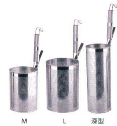
13 UK18-8 パイプ柄パンチング スパゲティてぼ(穴径1.5mm) [ATBC-03]

サイズ M φ135×H180 13-0166-1201 ¥ 9,800 L φ155×H220 13-0166-1202 ¥10,700 深型 φ115×H300 13-0166-1203 ¥10,600 柄長:185