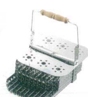
③ 18-8 えび茹器 [AEBY-01]

13-0169-0301 ¥32,000 サイズ:205×220 1段11列×5段 1列幅15 ●海老を真っ直ぐ形を整えたまま茹でる調理器です。最大55尾を茹で上げます。