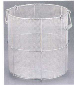
⑤ 18-8 スープ取りざる 寸胴型 [BSPZ-02]

13-0169-0401 ¥12,300 外寸:φ200×H300 取手寸法:150 内寸:φ175×H290 アミ:18メッシュ ●1,000ccまでのレードルがすっぽり入るので、スープだけをすくうのに大変便利です。