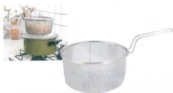
① TSステンレス ボイルバスケット (18-8アミ・16メッシュ) [BBOB-01] 目