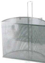
⑧ UK18-8 パンチング 半丸スープ取りザル [BSPZ-05]