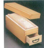
⑩ 鯉節削箱 [BKAK-03] 目

13-0169-0901 ¥8,000 サイズ:205×192×H261 ●押さえて回すだけ。楽々安全に削れます。 ●底面の吸着盤により、安定した切削ができます。 ●可動するストッパーで、節節の大きさ、形を選ばず最後までほとんど残りなく削れます。 ●面倒な刃の調整が無く、替え刃方式です。