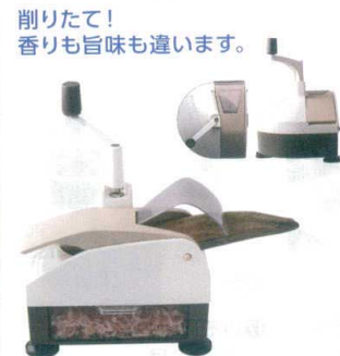
削りたて! 香りも旨味も違います。