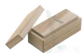
⑪ 鯉節 ミニ [BKAK-08] 目