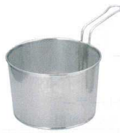
② 18-8 パンチング ボイルバスケット 片手ハンドル [BBOB-03]