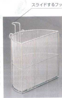
スライドするフック