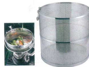
⑦ UK18-8 パンチング スープ取りザル [BSPZ-04]