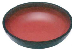
⑧ 普及型こね鉢 [AKNB-08] B

13-0173-0701 ¥6,300 サイズ:φ360×95 材質:ABS樹脂