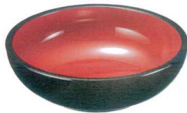
⑦ R2 ABS こね鉢 外黒内朱天黒 [AKNB-03]

13-0173-0701 ¥6,300 サイズ:φ360×95 材質:ABS樹脂