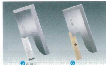
⑤ 切れ者 麵切包丁(片刃) A-1012 300mm [CHOC-02] B

13-0173-0501 ¥28,000 材質:安来鋼青紙II号 重量:700g