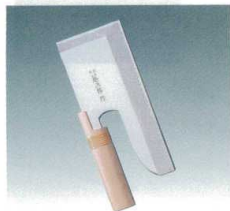
① 藤次郎 そば切 F-738 (片刃) 24cm [CHEM-02] B

13-0173-0101 ¥11,000 全長:270mm 重量:375g 背厚:3.0 材質:モリブデンバナジウム鋼