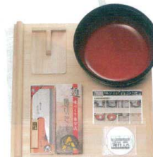
⑬ 家庭用麵打ちセット A-1230 [AMNB-04] B

13-0173-1201 ¥41,300 麵台:750×750×H25(桐) 麵棒:φ30×750 こね鉢:φ480 こま板:200×245 麵切包丁:刃渡り270、370g 付属品:そば打ち・うどん打ち入門DVD ●麵台・こね鉢が大きいので、麵打作業が楽にできます。