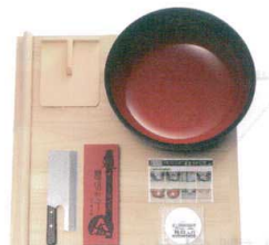
⑫ 普及型麵打セット(大) A-1260 [AMNB-06] B

13-0173-1101 ¥58,000 サイズ:600×400×H160 重量:6.6kg 包丁:刃渡り約270mm(SUS-440A) 台材質:アルミニウム ●包丁の上げ下げにより、自動的に右から左に移動、左側まで使った後は簡単に包丁部を右へ移動できます。 ●調整板で切り幅を自在に調整できます。(約1.5~10mm)