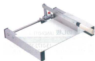
⑩ 麵切台 A-1000 [CMNK-01] B

13-0173-1001 ¥43,000 サイズ:445×365×H160 重量:4.5kg 包丁:刃渡り約225mm(SUS-440A) 台材質:アルミニウム