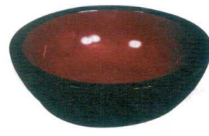
⑨ コネ鉢 黒内朱 [AKNB-07] B