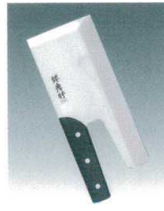
② 堺孝行 イノックス そば切 [CHDV-01] B

13-0173-0101 ¥11,000 全長:270mm 重量:375g 背厚:3.0 材質:モリブデンバナジウム鋼