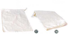
17 厚手ガーゼ だしこし袋 [BDAS-08] 目

サイズ 大 400×450 13-0176-1501 ¥1,800 小 330×410 13-0176-1502 ¥1,300