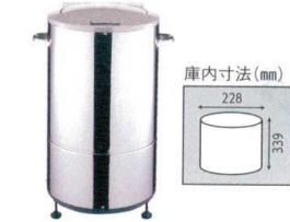
2 野菜脱水機 VS-500A (10kgタイプ) [AYMZ-16] 目

13-0176-0101 ¥278,000 サイズ:430×388×H457 電源:単相100V 50/60Hz 消費電力:175/135W 定格時間:連続 重量:26kg タイマースイッチ:最長15分 付属品:排水ホース1.5m×1本 脱水袋×1枚 ●キャベツなら3kgを約2分で脱水できます。 ●野菜は脱水袋に入れるだけで取扱いが簡単です。 ●停止時安全なブレーキ装置付。 ●タイマー付。