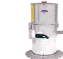
4 食品脱水機 OMD-10R3 (高速タイプ) [AYMZ-08] 目

3 野菜脱水機用 脱水袋 (VS-250N・VS-500A共通) [AYMZ-07] 目 13-0176-0301 ¥2,800 サイズ:450×500