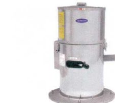
5 食品脱水機 OMD-10RY3 (低速タイプ) [AYMZ-09] 目

13-0176-0401 ¥430,000 サイズ:574×574×H805(突起物含まず) 電源:単相100V 0.2kW 能力:5~7kg/回 回転数:1,500rpm シリンダー径:φ250 重量:65kg 付属品:脱水袋1枚 ●袋仕様ですので、みじん切り食材の脱水に最適です。 ●上部外板・回転シリンダーなど、洗浄が必要な部品が簡単に取り外し洗浄できますので衛生的です。