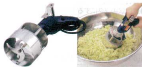
10 餃子具カッター GGC-4 [AGYX-13] 目

13-0176-1001 ¥55,000 サイズ:φ152×全長363 電源:単相100V 材質:刃/18-8ステンレス ●手持ちタイプになりますので、自由自在に動かせ好きな粗さに調節しやすいです。 ●飛散防止樹脂カバー付 ●S字2枚刃仕様。