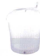
11 トンボ 抗菌ジャンボ野菜水切り器 [AYMZ-02] 目

13-0176-0901 ¥49,000 サイズ:φ250×260 全高:630 容量:約5kg 重量:20.6kg