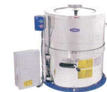
6 食品脱水機 OMD-18R3 (高速タイプ) [AYMZ-10] 目

13-0176-0501 ¥430,000 サイズ:574×574×H805 シリンダー径:φ290 電源:単相100V 0.2kW 能力:5~7kg/回 回転数:800rpm 重量:67kg 付属品:ステンコゴ ●カット野菜、解凍後の食材の水切りに最適です。