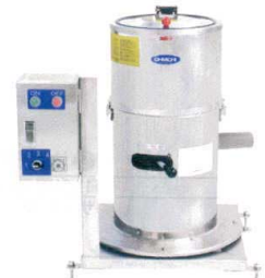
7 食品脱水機 OMD-10RZ4-R (変速タイプ) [AYMZ-20] 目

13-0176-0601 ¥1,200,000 サイズ:767×767×H875 シリンダー径:φ460 電源:3相200V 0.75kW 能力:10~20kg/回 回転数:960rpm 重量:150kg 付属品:脱水袋×1枚 ●素材の水分が無いようにしたい物、例えば餃子に利用するキャベツ、野菜等のようなものに使用します。