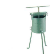
9 鉄製 餃子絞り器 [AYMZ-13] 目

13-0176-0801 ¥85,000 サイズ:φ250×310 全高:810 容量:約5kg 重量:17.3kg