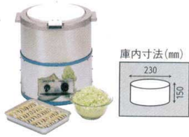
1 野菜脱水機 VS-250N (4kgタイプ) [AYMZ-05] 目

13-0176-0101 ¥278,000 サイズ:430×388×H457 電源:単相100V 50/60Hz 消費電力:175/135W 定格時間:連続 重量:26kg タイマースイッチ:最長15分 付属品:排水ホース1.5m×1本 脱水袋×1枚 ●キャベツなら3kgを約2分で脱水できます。 ●野菜は脱水袋に入れるだけで取扱いが簡単です。 ●停止時安全なブレーキ装置付。 ●タイマー付。