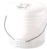
12 野菜水切り器 パリパリサラダ パケツ [AYMZ-23] 目

10型 φ340×H340 (455) φ270×H230 10 13-0176-1101 ¥29,000 20型 φ430×H410 (525) φ340×H310 20 13-0176-1102 ¥34,000 ( )内はハンドルを含めた高さです。 材質:本体、フタ、グリップ/ポリプロピレン カゴ/ポリエチレン 水抜き/シリコンゴム 脚ゴム/NRゴム その他/ナイロン、アルミ、SUS 耐熱温度:本体・フタ/120°C カゴ/70°C