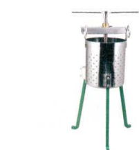
8 18-8 餃子絞り器 [AYMZ-12] 目

13-0176-0701 ¥650,000 サイズ:824×641×H836 シリンダー径:φ250 電源:単相100V 0.2kW 能力:5~7kg/回 回転数:100~1,500rpm 重量:75kg 付属品:移動用キャスター×4個、脱水袋×1枚 ●タイマー付(最大5分) ●食材に合わせて自在に回転速度を変更できますので、最適な脱水状態を選択できます。