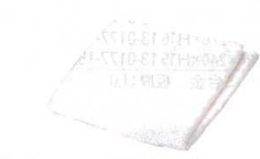
14 ナイロン 餃子絞り袋 [AGYX-02]

13-0176-1301 ¥4,200 サイズ:450×450 材質:バイレン ●入口の部分がミミになっており、そのまま上部で結べます。