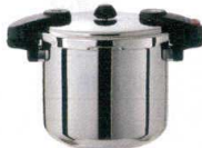
④ ワンダーシェフ プロ業務用圧力鍋 [AATN-28] E

内寸 炊飯 豆(ℓ) kg 13-0018-0301 ¥107,000 15ℓ φ280×H242 1.5升 5.0 5.9 13-0018-0301 ¥107,000 20ℓ φ280×H320 1.5升 6.6 6.2 13-0018-0302 ¥116,000 ●取手はステンレスキャスト製で清潔・強固です。