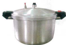
⑩ 業務用圧力鍋 SHP [AATN-23] E

サイズ ℓ kg 13-0018-1001 ¥144,000 SHP-16 φ500×307×298 16 5.0 13-0018-1001 ¥144,000 SHP-22 φ562×375×342 22 8.0 13-0018-1002 ¥161,000 材質:アルミニウム合金 ●肉類、魚介類、野菜スープベースの煮込み、製菓および味噌製造工程における豆類の下煮、シチュー、グラッセ、コンポートなどの煮込み全般、蒸し物、茹で物に対応。