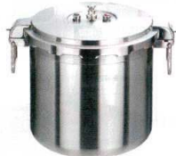
① ワンダーシェフ 業務用プロビック 圧力鍋 30ℓ [AATN-08] ◯ E

13-0018-0101 ¥187,000 サイズ:内径φ345×H330 重量:8kg 白米炊飯量:1升5合 豆類線:約10.0ℓ ●業務用のビッグサイズ。 ●持ちやすいワイヤーハンドル仕様。