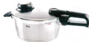
⑭ フィスラー ビタビットプレミアム 圧力鍋 [AATN-38] J