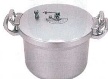
⑪ ホクア 業務用アルミ圧力鍋 [AATN-02] E

サイズ ℓ kg 13-0018-1001 ¥144,000 SHP-16 φ500×307×298 16 5.0 13-0018-1001 ¥144,000 SHP-22 φ562×375×342 22 8.0 13-0018-1002 ¥161,000 材質:アルミニウム合金 ●肉類、魚介類、野菜スープベースの煮込み、製菓および味噌製造工程における豆類の下煮、シチュー、グラッセ、コンポートなどの煮込み全般、蒸し物、茹で物に対応。