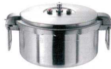
② ワンダーシェフ 業務用プロビック 圧力鍋 浅型 16ℓ [AATN-19] E

13-0018-0101 ¥187,000 サイズ:内径φ345×H330 重量:8kg 白米炊飯量:1升5合 豆類線:約10.0ℓ ●業務用のビッグサイズ。 ●持ちやすいワイヤーハンドル仕様。