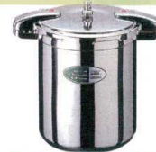
③ ワンダーシェフ 業務用プロビック 圧力鍋 [AATN-07] ◯ E

13-0018-0201 ¥113,000 サイズ:内径φ345×H165 重量:7.2kg 白米炊飯量:22合 豆類線:約5.3ℓ ●浅型大口径なので魚など重ね煮出来ない調理もおまかせ ●持ちやすいワイヤーハンドル仕様。