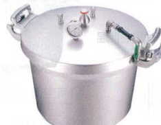
⑫ アルミ 業務用圧力鍋(第2安全装置付) [AATN-03] E

内径×高さ 最大炊量 kg 13-0018-1101 ¥110,000 15ℓ 360×162 2.0升 8.9 13-0018-1101 ¥110,000 18ℓ 360×192 2.4升 9.5 13-0018-1102 ¥140,000 21ℓ 360×228 2.7升 9.7 13-0018-1103 ¥170,000 24ℓ 360×260 3.0升 10.1 13-0018-1104 ¥160,000 材質:アルミキャスト製 底厚:7.0 安全フィルター付 ※最大炊量は米の炊き量です。