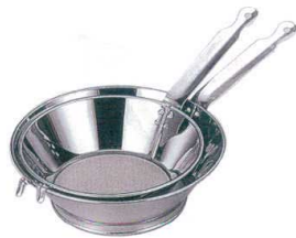
1 18-0 強力油こし [AABK-03]