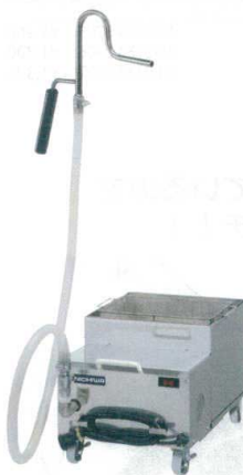
10 食用油濾過器 [EROK-01]

サイズ 容量 NK-25 334×500×H330 25ℓ 13-0185-1001 ¥295,000 NK-35 334×630×H330 35ℓ 13-0185-1002 ¥318,000 電源:単相100V 50/60Hz 消費電力:0.2kW 濾過能力:約6ℓ/分 リード線:2mプラグ付2P-15A 付属品:メタルフィルター・カス取りカゴ・カス取りバスケット・濾紙押さえ金具・耐熱ホース・濾布(各1)濾紙(5枚) ●食用油の酸化・劣化を防ぎフライの品質を高めます。 ●使用した油の微粒子、炭化物、不純物をまったく取り除き食用油の寿命を延ばし(2~3倍)、廃油発生を防ぐ高性能濾過機です。 ●簡単な操作で、油をいつまでも美しく経済的にお使いいただけます。