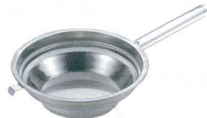
5 UK18-8 段付油こし 片手 ハンドル(パンチ網) [AABK-05]