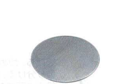
8 UK18-8 油こし用 替えパンチ網 [AABK-09]