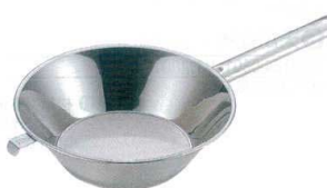
6 UK18-8 油こし 片手 ハンドル(パンチ網) [AABK-07]