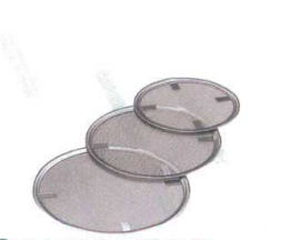
4 18-8 油こし用 替えアミ