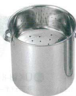
12 18-8 天ぶらカス入 手付 [ATKI-01]