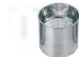
11 18-8 天ぶらカス入 [ATKI-02]

サイズ 容量 NK-25 334×500×H330 25ℓ 13-0185-1001 ¥295,000 NK-35 334×630×H330 35ℓ 13-0185-1002 ¥318,000 電源:単相100V 50/60Hz 消費電力:0.2kW 濾過能力:約6ℓ/分 リード線:2mプラグ付2P-15A 付属品:メタルフィルター・カス取りカゴ・カス取りバスケット・濾紙押さえ金具・耐熱ホース・濾布(各1)濾紙(5枚) ●食用油の酸化・劣化を防ぎフライの品質を高めます。 ●使用した油の微粒子、炭化物、不純物をまったく取り除き食用油の寿命を延ばし(2~3倍)、廃油発生を防ぐ高性能濾過機です。 ●簡単な操作で、油をいつまでも美しく経済的にお使いいただけます。