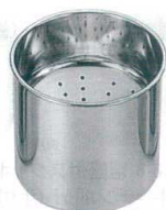
11 18-8 天ぶらカス入 [ATKI-02]

サイズ 容量 品番 価格 NK-25 334×500×H330 25ℓ 13-0185-1001 ¥295,000 NK-35 334×630×H330 35ℓ 13-0185-1002 ¥318,000 電源:単相100V 50/60Hz 消費電力:0.2kW 濾過能力:約6ℓ/分 リード線:2mプラグ付2P-15A ⑩ 付属品:メタルフィルター・カス取りコゴ・カス取りバスケット・濾紙押さえ金具・耐熱ホース・濾布(各1)濾紙(5枚) ●食用油の酸化・劣化を防ぎフライの品質を高めます。 ●使用した油の微粒子、炭化物、不純物をまったく取り除き食用油の寿命を延ばし(2~3倍)、廃油発生を防ぐ高性能濾過機です。 ●簡単な操作で、油をいつまでも美しく経済的にお使いいただけます。