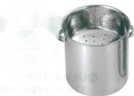
12 18-8 天ぶらカス入 手付 [ATKI-01]