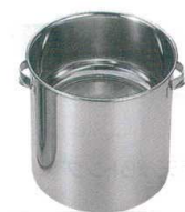
13 18-8 替えアミ式 揚玉入 [ATKI-03]