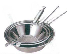
3 18-8 替えアミ式 油こし