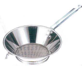
2 プリキ油こし [AABK-04]