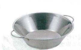
7 UK18-8 油こし 両手 ハンドル(パンチ網) [AABK-08]