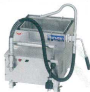
9 油ろ過機 MOF-20 [EROK-04]

13-0185-0901 ¥211,000 サイズ:330×575×H315 容量:20ℓ 電源:単相100V 50/60Hz 消費電力:150W 濾過能力:6/5.5ℓ毎分(50/60Hz) リード線:3mプラグ付(接地アダプター)⑩ 付属品:ろ紙(10枚)、ろ布(1枚)、延長コード ●コンパクト設計でフライヤーの下に収納できます。 ●カス取りアミとろ紙の二重ろ過で細かい揚げカスや不純物がしっかりと取り除けます。