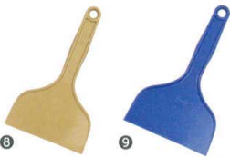
8 ホテイ印 ポリヘラクリーム

幅 全長 品番 価格 大 125 205 13-0190-0201 ¥1,660 小 100 180 13-0190-0202 ¥1,240 耐熱温度:150°C