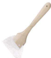
10 木柄 三角シリコンゴムヘラ 長柄

13-0190-0301 ¥1,200 サイズ:幅95×全長195 耐熱温度:150°C