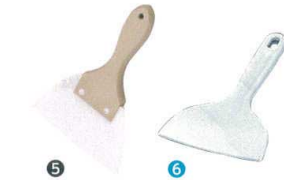
5 木柄 三角シリコンゴムヘラ

[BSPT-14] △ 大 155 350 13-0190-1001 ¥2,740 大 120 335 13-0190-1002 ¥2,200 小 94 303 13-0190-1003 ¥2,010 耐熱温度:-20°C~250°C