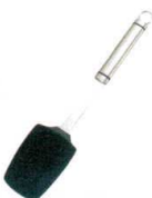
15 18-8 ハンドクリーナー スコップ型 [BSPT-31] △

[BSPT-52] △ 13-0190-1201 ¥4,580 サイズ:幅125×全長365 耐熱温度:200°C