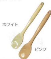
14 シリコンクリーンヘラ スプーン型 小 [BSPT-43] △

[BSPT-50] △ 大 127 220 13-0190-0901 ¥880 小 95 200 13-0190-0902 ¥580 耐熱温度:180°C