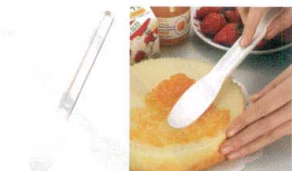
20 フードヘラ(食瓶用ヘラ)No.161

13-0190-1901 ¥1,500 サイズ:幅48×全長272 材質:本体/シリコンゴム 芯棒/ステンレス 耐熱温度:-20°C~204°C ●空気を含ませながらケーキのたねをまぜることができます。