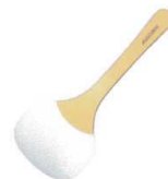
7 抗菌タフネス裏ごしヘラ

[BSPT-04] △ 13-0190-1601 ¥920 サイズ:幅35×全長240 材質:ヘラ部/シリコンゴム(耐熱200°C) ハンドル/AS樹脂(耐熱80°C) 耐熱温度:ヘラ部/200°C ハンドル/80°C ●お料理のとりわけに便利です。