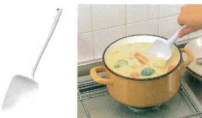
19 スプーン型シリコンゴムヘラ No.1627 [BSPT-56] △

13-0190-1701 ¥1,500 サイズ:幅53×全長250 耐熱温度:-20~200°C 材質:本体/シリコンゴム 中芯/ナイロン66・特殊銅 ●熱に強く混ぜる、寄せる、すくうといった機能を兼ね備えています。 ●シリコンゴムとナイロン樹脂、さらに金属の芯を入れてあるので、力をかけてもねじれにくい構造になっています。