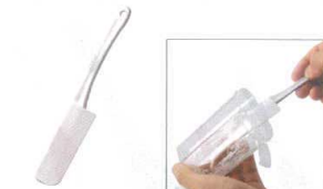
21 ミニケーキヘラ No.1209

[BSPT-55] △ 13-0190-2001 ¥280 サイズ:幅34×全長255 材質:ポリプロピレン 耐熱温度:-20°C~120°C