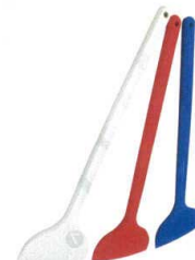
13 シリコンクリーンヘラ 特大 [BSPT-44] △

[ASPT-23] E 洗 抗菌 UH-135-340 135 340 13-0190-0701 ¥9,800 UH-90-340 90 340 13-0190-0702 ¥8,700 材質:超高分子量ポリエチレン・ナイロン