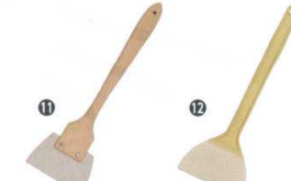
11 ホテイ印 長柄ゴムヘラ

13-0190-0601 ¥2,150 サイズ:幅110×全長205 耐熱温度:260°C ●一体成型ナイロン芯入