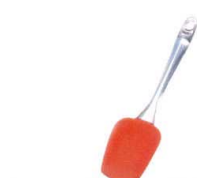
16 シリコンクッキングスプーン

13-0190-1501 ¥1,300 サイズ:幅65×全長303 耐熱温度:200°C 材質:本体/18-8ステンレス鋼 ヘラ部/シリコン樹脂 樹脂部/ABS樹脂