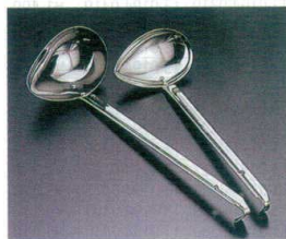
5 18-8 横口レードル [BYRD-01]