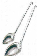
6 18-8 縦口レードル [BRDL-08]