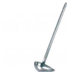
9 18-8 長柄 横口レードル [BYRD-03]