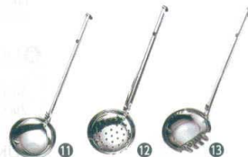
11 18-0 レードル柄 お玉 [BOTA-03]