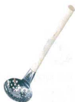
15 18-8 牛丼杓子 [BRDL-30]