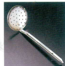
14 18-0 スキナー [BSKM-03]