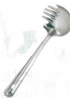
18 18-0 うどん杓子 [BOTA-18]