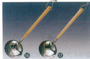
16 18-0 木柄レードル 穴明 [BRDL-011]