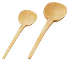
4 木製 汁杓子 [BOTC-01] 目