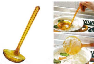
13 トータルカラー アク取りお玉