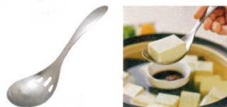
11 18-0 水切りスプーン LS1506 [BRDL-27] 目

13-0196-0901 ¥1,800 サイズ:80×全長285 ●柄を傾げるだけでサッと汁が切れます。 ●一体成型なので衛生的です。