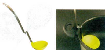
14 シリコン 腰かけお玉 [BOTD-01] 目

13-0196-1301 ¥1,300 サイズ:φ94×293 材質:ポリエーテルイミド 耐熱温度: -20℃~204℃ ●アクの上にお玉を浸すだけで、突起部分に吸着します。 ●お玉の内側に計量ライン(100、50、30、15、5ml)が付いているので大変便利です。