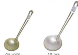
3 アルマイト 杓子(お玉) [BOTB-02]