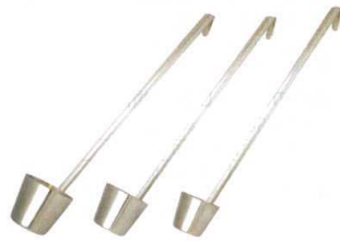
5 18-8 カンロレードル [BKRR-05] △