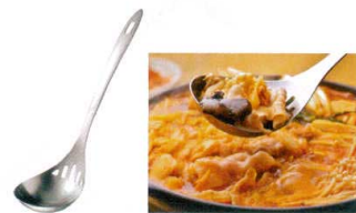
9 18-0 水切りレードル LS1508 [BRDL-26] 目

13-0196-0901 ¥1,800 サイズ:80×全長285 ●柄を傾げるだけでサッと汁が切れます。 ●一体成型なので衛生的です。