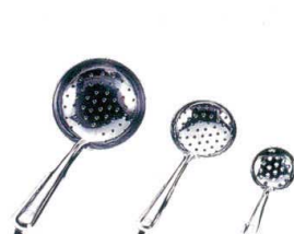
2 18-0 穴明杓子 [BOTA-02]