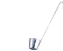
6 18-8 カンロ杓子 [BKRR-01] △