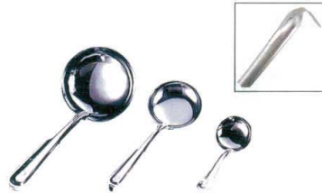
1 18-0 杓子 [BOTA-01]