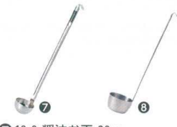
7 18-8 醤油お玉 28cc [BRDL-32]