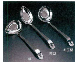
12 ステンレス あくとりレードル [BRDL-03]

13-0196-1101 ¥1,300 サイズ:58×全長185 ●汁物おかずのとりわけ時に、傾げるだけでサッと汁が切れます。