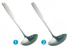
1 ののじ 18-8 お玉 80cc [BOTA-15] ◆G

フック付 LB-FS001 13-0197-0101 ¥1,900 フック無 LB-NS001 13-0197-0102 ¥1,900 サイズ:φ90×柄230 重量:130g