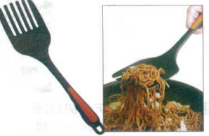
17 ののじ マゼモ・モコモコ LTM-MN01 [BOTM-07] G

13-0197-1601 ¥800 サイズ:135×全長365 重量:105g 耐熱温度:200°C ●水切れの良い大穴で、少量の食材の茹で上げに最適です。