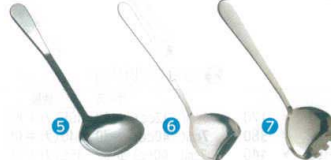
5 ののじ 18-8 プチお玉 20cc LB-NS051 [BOTA-26] G

13-0197-0401 ¥2,900 サイズ:φ100×柄230 重量:150g ●麺やスープだけでなく、お惣菜も取りやすい。