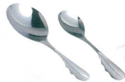
12 ののじ 18-8 スーパーオタモ [BOTM-02] G

サイズ 全長 大 LTM-H02 147 373 13-0197-1101 ¥3,200 小 LTM-H01 102 310 13-0197-1102 ¥1,800 重量:大/220g 小/125g パンチング穴径:3