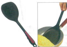
14 ののじ ペタモ・モコモコ LTM-PN01 [BOTM-04] G

13-0197-1401 ¥800 サイズ:120×全長350 重量:92g 耐熱温度:200°C ●天板から吸い付く様にすくい上げれます。