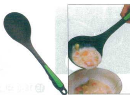
15 ののじ オタモ・モコモコ LTM-NO1 [BOTM-05] G

13-0197-1401 ¥800 サイズ:120×全長350 重量:92g 耐熱温度:200°C ●天板から吸い付く様にすくい上げれます。