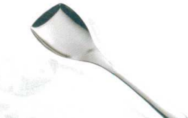
13 ののじ 18-8 バットサーパー LBS-S010 [BTAN-34] G

サイズ 全長 大 LTM-SU02 φ147 373 13-0197-1201 ¥4,500 小 LTM-SU01 φ 90 300 13-0197-1202 ¥2,500 容量:大/400cc 小/55cc 重量:大/310g 小/185g ●柄は手にフィットする中空立体グリップ。