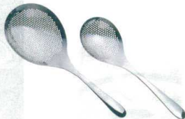
11 ののじ 18-8 穴明オタモ [BOTM-03] G

サイズ 全長 大 LTM-HU02 147 373 13-0197-1001 ¥6,200 小 LTM-HU01 102 310 13-0197-1002 ¥3,200 重量:大/270g 小/170g パンチング穴径:3 ●柄は手にフィットする中空立体グリップ。