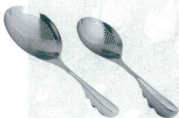
10 ののじ 18-8 スーパー穴明きオタモ [BOTM-01] ◇G

サイズ 全長 大 LTM-HU02 147 373 13-0197-1001 ¥6,200 小 LTM-HU01 102 310 13-0197-1002 ¥3,200 重量:大/270g 小/170g パンチング穴径:3 ●柄は手にフィットする中空立体グリップ。