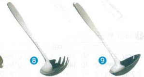
8 ののじ 18-8 ノードル杓子 [BRDL-18] ◇G

13-0197-0701 ¥1,300 サイズ:170×71 重量:65g ●3本の歯で引っ掛けるので混ぜたり、すくったりしやすく、取り分けに便利。