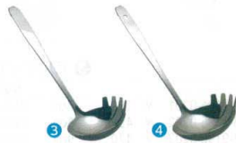
3 ののじ 18-8 歯付きお玉 80cc [BOTA-13] ◆G

フック付 LB-FS010 13-0197-0201 ¥2,100 フック無 LB-NS010 13-0197-0202 ¥2,100 サイズ:φ91×柄230 重量:145g