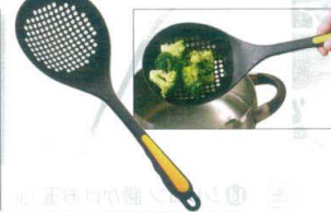
16 ののじ アミオタモ・モコモコ LTM-HN01 [BOTM-06] G

13-0197-1501 ¥800 サイズ:100×全長335 重量:80g 耐熱温度:200°C ●柄とお玉部分が平行になっているので、「すくって→そよ」動作がスムーズに行えます。