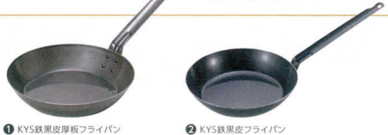
① KYS鉄黒皮厚板フライパン ② KYS鉄黒皮フライパン