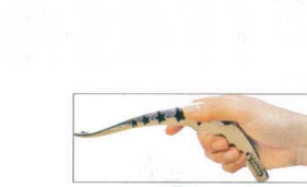
⑮ ののじ UD箸トング