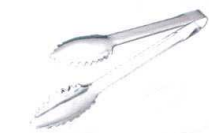
⑥ 18-0 セーフティリーフトング [BTGD-13]