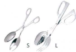
⑤ UK18-8 サーバートング