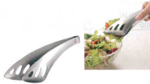
⑫ 18-0 ゆびさきサーバートング