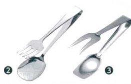
② 18-0 ホテル型サービストング 大