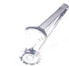
⑧ 18-0 セーフティチェリートング [BTGD-15]