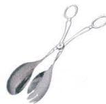
④ 18-8 サラダトング