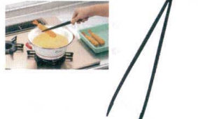
⑯ はしトング [BTGE-03] 洗