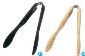
⑰ 木製 アームトング [BTGD-62] 洗