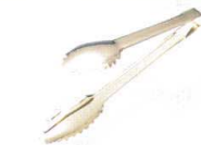
⑨ 18-0 ゴールドセーフティリーフトング [BTGD-16]