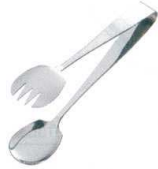
① 18-0 サラダサービストング