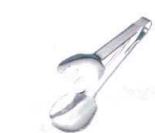
⑦ 18-0 セーフティサラダトング [BTGD-14] △