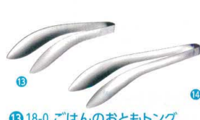
⑬ 18-0 ごはんのおともトング