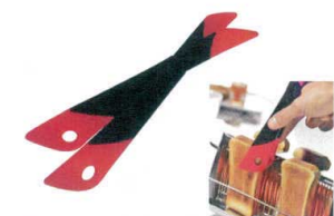
⑳ マルチトング ラズベリー