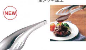
⑬ 18-0 ソースもすくえるガッツリトング