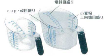
3 ユニバーサルメジャーカップ(ブラック)