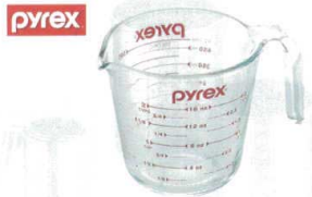
1 パイレックス メジャーカップ