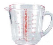
6 メタクリル メジャーカップ