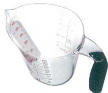
4 KHS上から量れる計量カップ 600ml DH-7364