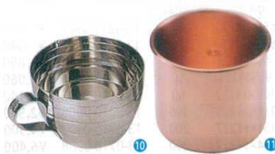
10 18-8 椀型計量カップ