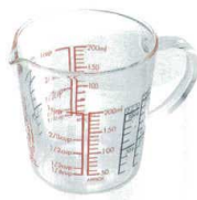
2 メジャーカップワイドCMJW