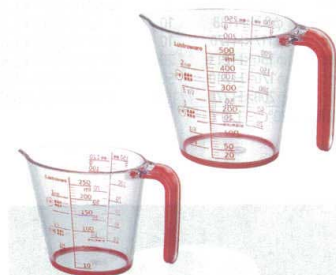
7 ラストロウェア メジャーカップ (レッド)