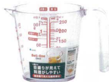
5 ベルワン 耐熱計量カップ クリアー