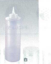
② ディスペンサー 720cc(目盛付) [BDPS-02]

※ディスペンサー400cc、360cc、270cc、食品ボトルのφ62mmまで使用できます。 ※ディスペンサーは別売りです。