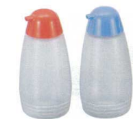
⑪ クリーン しょう油差し [BSYO-02] □

サイズ: φ70×H145(320cc) 材質: 本体/ポリエチレン フタ/AS樹脂