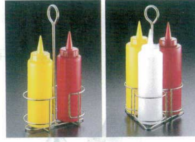
⑤ 18-8 新型ディスペンサー スタンド [BDPS-04]

材質: ポリエチレン 耐熱: -30℃~90℃ ●マヨネーズ等を格子模様レイアウトできます。 ●先端はカットされていません。