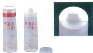
⑨ マジックファイブ ディスペンサー [BDPS-15] △

材質: 本体/ポリプロピレン バルブ/シリコン 抽出口径: φ7.5mm ●逆止弁キャップなので、液だれしにくくなっています。 ●下向きに立てることができるので、最後まで出しやすいです。