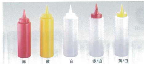
① ディスペンサー [BDPS-01] ◇