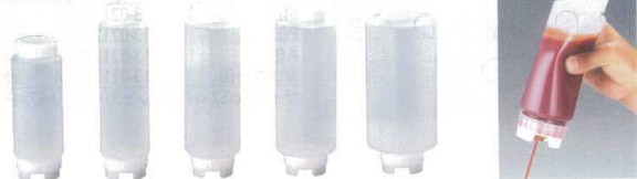
⑦ FIFO (ファイフォ) ボトルディスペンサー [BDPS-11] □