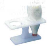
⑥ PC マヨネーズ立て [BDPS-17] △