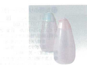
⑩ トンボ ペンギン正油大 [BSYO-01] □

材質: 本体/ポリエチレン キャップ/ポリプロピレン ●先端に5つの穴が開いており、マヨネーズ等を格子模様レイアウトできます。 ●蓋が付いているので、衛生的です。