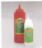
③ ディスペンサー(ラベル付) [BDPS-03]