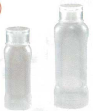
⑧ ピタッと倒立ボトル [BDL-08] △