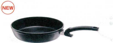
11 フィスラー レヴィタル プラス コンフォート [AFPB-70] U IH

20cm φ200×H55 0.8 145 13-0022-1001 ¥19,000 24cm φ240×H65 1.1 185 13-0022-1002 ¥23,000 28cm φ280×H65 1.8 225 13-0022-1003 ¥27,000 材質:本体・取手/ステンレス鋼 底/アルミニウム合金・ステンレス鋼 ●高品質で耐久性に優れ完璧な表面の焼き上がりを実現。 ●フライパンのフチが幅広く、どこから注いでも液ダレしない気配り設計。 ●調理中でも熱が伝わりにくい「スティクール・メタルハンドル」