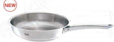
10 フィスラー スティルクス プロ フライパン [AFPA-10] U 洗 IH

24cm φ240×H65 1.1 185 13-0022-0901 ¥32,000 28cm φ280×H70 1.8 225 13-0022-0902 ¥36,000 材質:本体・取手/ステンレス鋼 底/アルミニウム合金・ステンレス鋼 ●独自開発した凹凸面「ノボグリップ」によって、表面はカリッと中はジュシーに調理ができます。 ●フライパンのフチが幅広く、どこから注いでも液ダレしない気配り設計。 ●18-10ステンレスを使用したサテン仕上げの美しいボディ