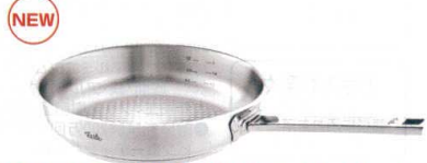
9 フィスラー オリジナルプロフィコレクションフライパン [AFPA-09] △ U 洗 IH

13-0022-0502 ¥22,000 サイズ:240×H59 重量:1.13kg 容量:2.5ℓ 板厚:5.6 底径:185 材質:ステンレスチール ●凹凸面によって余分な油を落としながら焼き上げるため、外はカリッと中はジュシーに焼き上げます。 ●熱伝導・保温性に優れた「底厚三層カプセル構造」 ●オールステンレスのため、オープン調理も可能です。