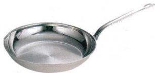
1 18-10 ロイヤルフライパン [AFPA-04] U IH