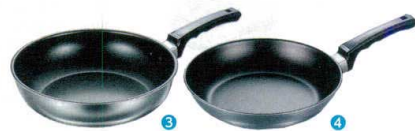
3 フジH いため鍋DX 27cm [AEML-10] E IH

13-0022-0301 ¥13,800 サイズ:φ270×H72 底径:180 重量:1.3kg ●内面フッ素樹脂加工