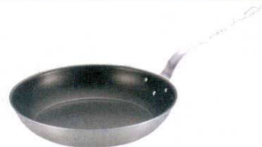
2 18-10 ロイヤル FC フライパン (フッ素樹脂加工) [AFPA-05] U IH