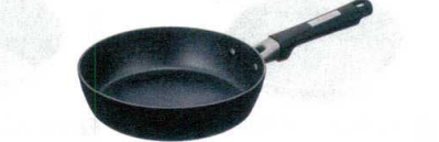
7 サーモスフライパン [AFPB-60] E IH