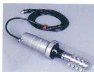
⑩ ピオニー電動ウロコ取り機 F-SR型 [BURT-01]

13-0224-1001 ¥132,000 サイズ:本体/φ65×255 コントローラー/110×180×H90 電源:本体/DC12V コントローラー/単相100V 50/60Hz 出力:本体/5W(1,250rpm) コントローラー/DC12V 回転数:500~1,250rpm ●スーパー・ホテル・レストラン・食品加工場等で、面倒なウロコ取り作業がグーンとスピードアップ。 ●左右回転切り替えスイッチ付の右きき・左ききどちらもOK。 ●スピード無段階調節。魚の大・小、種類を問いません。