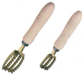
① 真鍮ウロコ取 [BURT-10] 全長 大 195 13-0224-0101 ¥1,400 小 175 13-0224-0102 ¥1,260