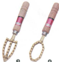
③ 真鍮 うろこ取 三角型 [BURT-19] 13-0224-0301 ¥1,800 全長:208 ●先端で細い部分、全体で広い部分のウロコを取れます。