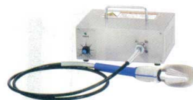
⑪ 電動ウロコ取り機 タスケール AST-150 [BURT-15]