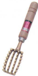
⑦ 業務用 真鍮 テーパー形羽根付 うろこ取り SG-206 [BURT-21] 13-0224-0701 ¥1,620 全長:190 ●角度(テーパー)がついているのでウロコの間に入りやすく、羽根が飛び散りを防止します。