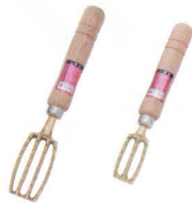
② 業務用 真鍮 うろこ取 [BURT-17] 全長 大 195 13-0224-0201 ¥1,100 小 175 13-0224-0202 ¥1,070