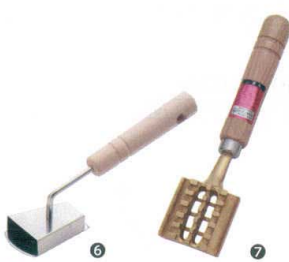
⑥ ステン 飛び散らないうろこ取 SG-204 [BURT-22] 13-0224-0601 ¥2,800 全長:220 ●取れたウロコが収納BOXに入るの、飛び散らず作業後の清掃も簡単です。