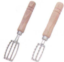
⑤ ステン 鋳物 うろこ取 [BURT-20] 全長 大 210 13-0224-0501 ¥2,400 小 180 13-0224-0502 ¥2,200