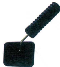
⑨ 鱗トル [BURT-16] 全長 S 160 13-0224-0901 ¥3,500 L 210 13-0224-0902 ¥5,800 材質:高強度食品用ゴム ●利き手を問わないユニバーサルデザイン。 ●4つの角を4つの面の全てでウロコを取ることができるので魚の大きさや種類を問わず、使えます。