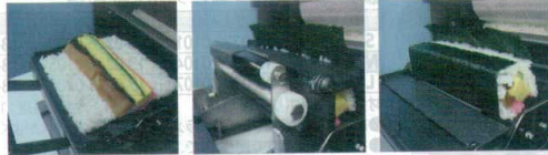
セミオートマチック巻装置

職人さんが手で巻くように、中央に巻芯が入った綺麗で美味しい巻寿司を素人の方でも効率良く簡単につくることができます。細巻・中巻・太巻への切替もユニット式でネジ等も無く簡単です。さらに高い安全性とメンテナンスが少ないのもセミオートタイプの特長です。*巻ユニットは付属1種以外はオプション設定です。