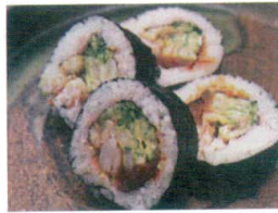
食感の良い仕上がり