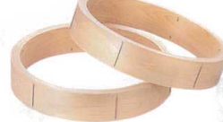
3 木曽駒印 桧 中華セイロ 台輪 [ASIR-15]