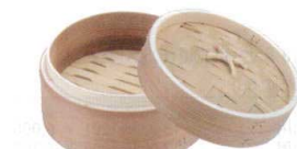
7 燕舞 杉中華ミニセイロ [ASIR-39]