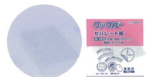
12 旭化成 クックパー セパレート紙(500枚入) [ASEP-01]