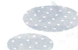
14 業務用両面シリコンペーパー リンベシート 丸型 穴明 [ASIP-01]