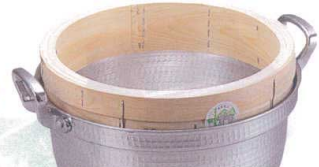
4 木曽駒印 桧 料理鍋用 台輪 [ASIR-16]