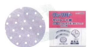
13 旭化成 クックパー 穴明きセパレート紙(500枚入) [ASEP-02]