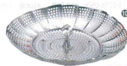
10 18-0 ジャンボスチーマー [ASTM-01]