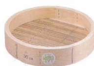
2 木曽駒印 桧 中華セイロ 身 [ASIR-14]