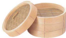
1 木曽駒印 桧 中華セイロ 蓋 [ASIR-13]